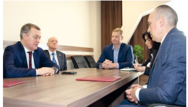
Представители ППК «Максимиха» презентовали возможности кластера рыбной промышленности Камчатки

Напомним, в 2021 г. предприятия Камчатки освоили в общей сложности свыше 1,6