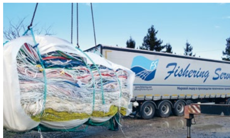
«Фишеринг Сервис» использует несколько альтернативных маршрутов и вариантов доставки продукции в Россию и иностранным клиентам