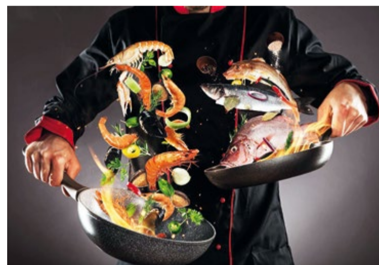
Мастер-классы шеф-поваров Russian Seafood Show станут не только украшением выставки Seafood Expo Russia в Санкт-Петербурге, но и финалом серии обучающих мероприятий «Рыба есть!»

определенному виду рыбы или морепродуктов. Мероприятия «Рыба есть!» призваны рассказать поварам, какие виды рыбы и морепродуктов сейчас доступны и актуальны, как их вылавливают, выращивают и перерабатывают. На встречах также научат правильно выбрать сырье, раскроют техники приготовления, предложат варианты сервировки.