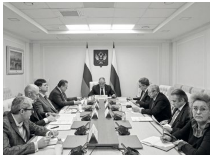
Заседание рабочей группы Совета Федерации по мониторингу нормативных актов в сфере рыболовства и аквакультуры

В этом году во время сезона «Б» минтаевой путины