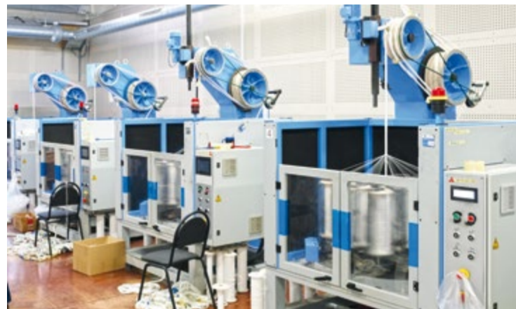
Наиболее важную часть канатов и делей компания выпускает самостоятельно, используя российское синтетическое волокно