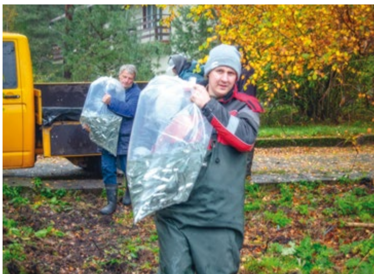
За лето и осень в Куршский залив отправилось в общей сложности 730 тыс. штук молоди сига — рекорд для Балтики

Куршского залива в результате деятельности человека привела к заилению естественных нерестилищ и утрате более 90% их площади по сравнению с 1940–1960 годами. Численность и биомасса сига сильно упала, что отразилось на уловах. Специализированный промысел этого вида весте запрещено, и рыбакам он попадает только в виде прилова. По данным Западно-Балтийского теруправления Росрыболовства, в 2022 году к вылову