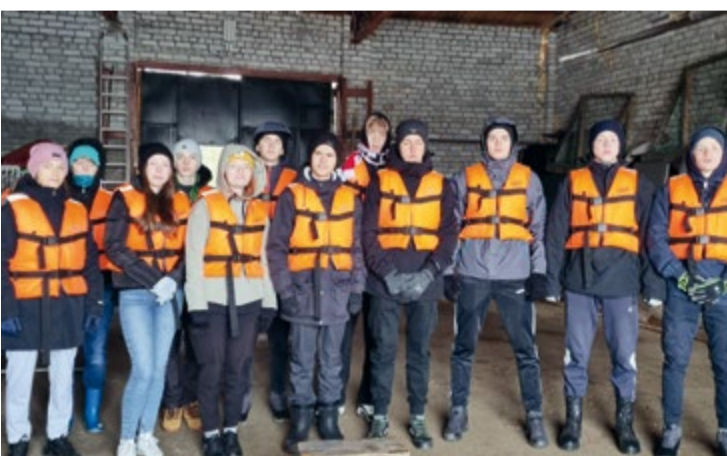
Для ребят из морских классов открываются заманчивые карьерные перспективы в рыбной отрасли

Обучение продолжалось на суше. Сотрудник МЧС показал школьникам, как оказывать первую медицинскую помощь, а специалисты отрасли — как вязать морские узлы.