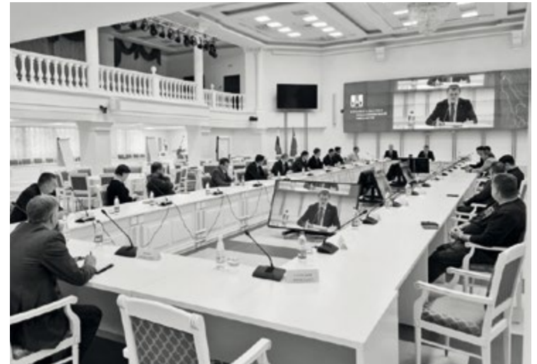
Ежегодное совещание с рыбопромышленниками в рамках профилактической работы прошло в правительстве Сахалинской области

В качестве еще одной актуальной проблемы министр обозначил отсутствие приказа о распределении квот по