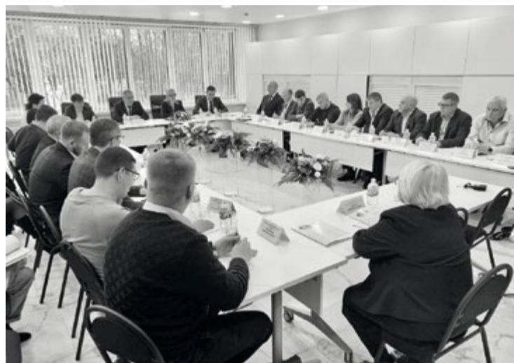
Важные для предприятий темы рассмотрело собрание уполномоченных представителей членов Хабаровского Крайрыбакколхозсоюза