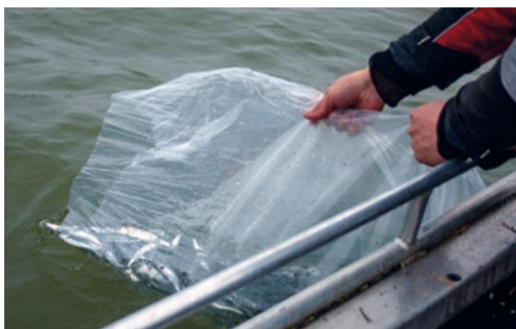
Для возмещения ущерба, наносимого прибрежной зоне, был выбран балтийский сиг