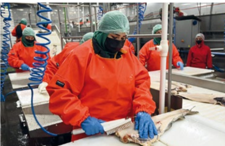
О производстве, обработке и хранении рыбной продукции школьникам рассказали на фабрике «Полярное море+»