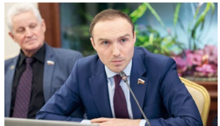
Заместитель председателя Комитета Госдумы по развитию Дальнего Востока и Арктики Антон БАСАНСКИЙ