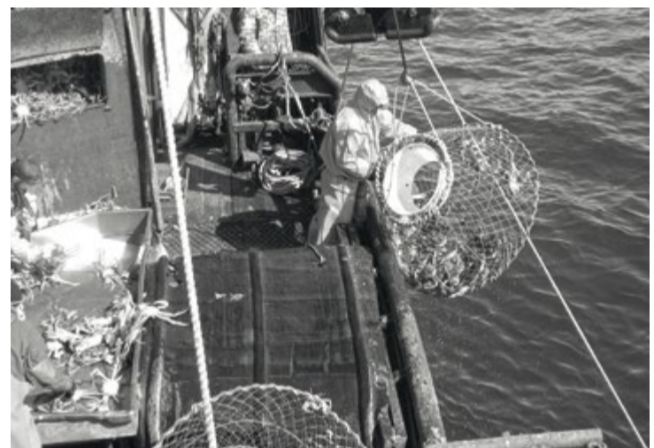
Добыча краба позволяет работать в том числе и производствам на отдаленных территориях