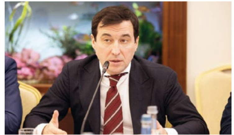
Первый заместитель руководителя фракции «Справедливая Россия — За правду» в Госдуме Дмитрий ГУСЕВ