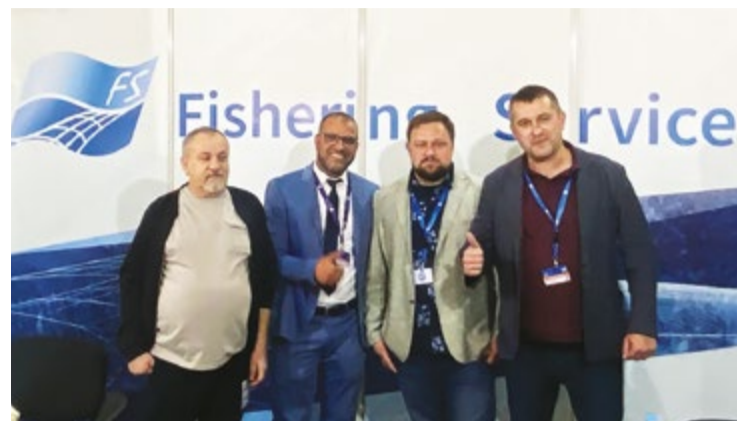
Заместитель директора порта Касабланка на стенде компании

В целом, по его мнению, рынок Марокко и вообще За-