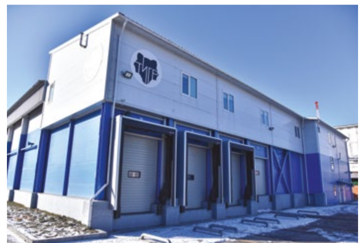
Новый холодильник Владморрыбпорта

Российский флот работает на промысле минтая с опережением результатов прошлого года. В размещении рыбной продукции планируется задействовать в том числе и новые холодильные мощности, созданные во Владивостоке.