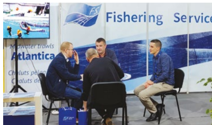
Промысловое вооружение производства «Фишеринг Сервис» присутствует на рынке Марокко более семи лет

падной Африки весьма перспективен для российского производителя тралов: «Здесь знают нашу продукцию, оценили ее высокое качество и про-