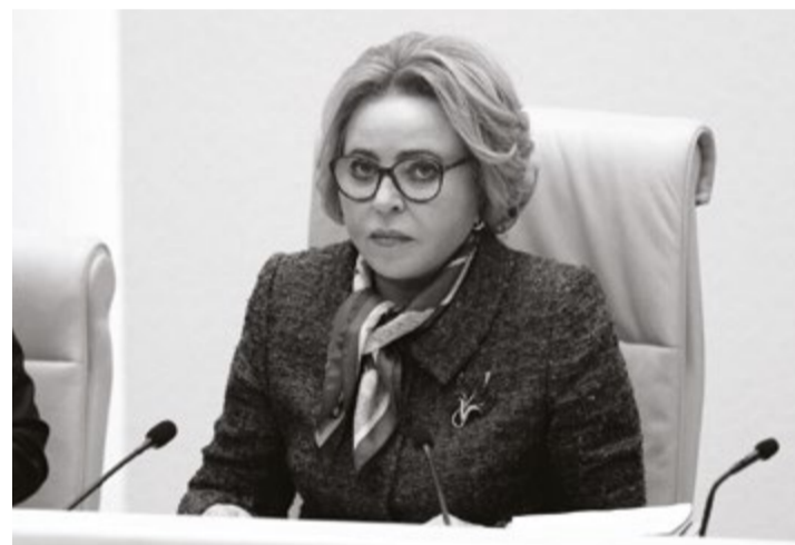
Валентина МАТВИЕНКО, спикер Совета Федерации