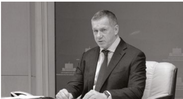
Юрий ТРУТНЕВ, вице-премьер — полпред президента в ДФО

Еще одна мера связана с предложением инвестиционного лизингового проекта для финансирования строительства судов за счет привлечения средств Фонда национального благосостояния под 1,5% годовых. Предложение Минпромторг отправил на рас-