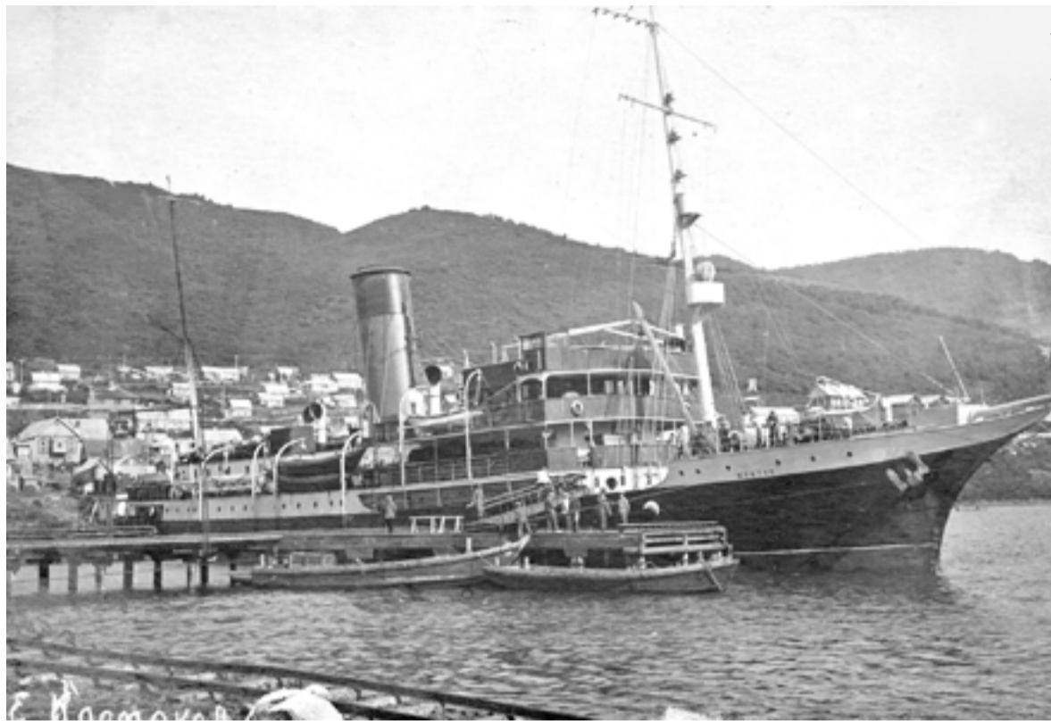
▲ Ледорез «Литке» в петропавловском порту

Отмечены и «мещанские взгляды на жизнь» среди части молодежи: «одна комсомолка говорила, что ей хотелось бы воспитывать своих детей так, как когда-то воспи-