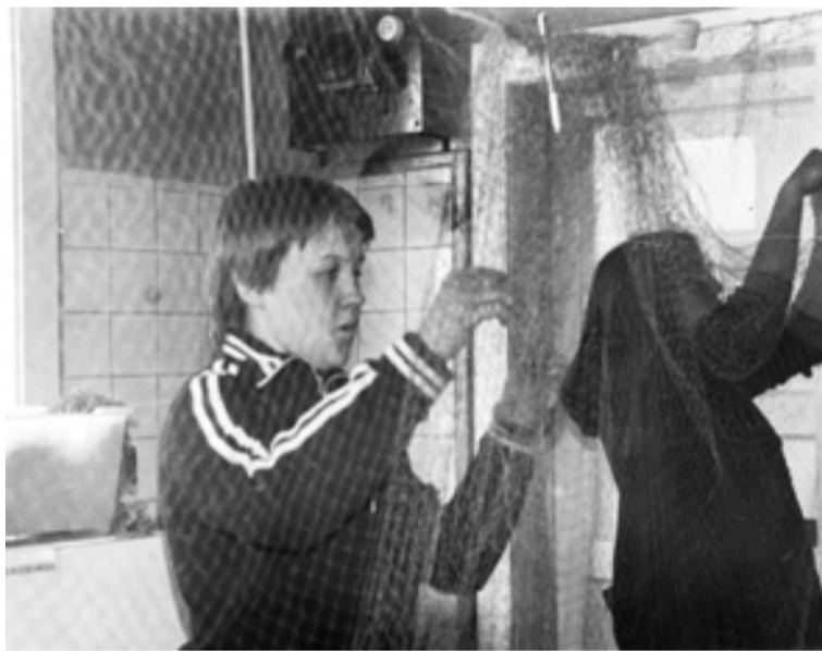
▲ Ихтиологическая практика на Белом море, 1984 год

В 1982 году она поступает в Московский государственный университет имени М.В. Ломоносова на биологический факультет. С первого курса студенты-биологи проходили полевые практики в разных уголках нашей необъятной страны: ботаническую практику – в Мордовии, по беспозвоночным животным и потом по рыбам – на Белом море, Соловках и в Якутии. А уже на 4-м курсе университета, собирая материал для своей дипломной работы, она впервые побывала на Камчат-