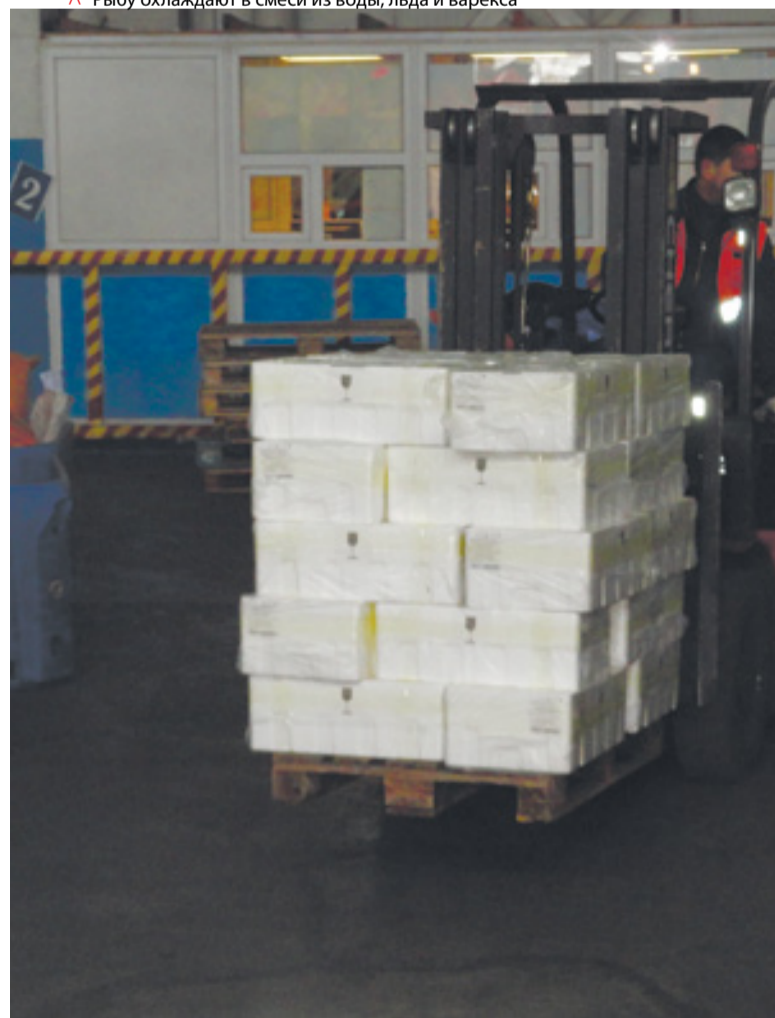
▲ Камчатская «охлажденка» идет на погрузку в самолет