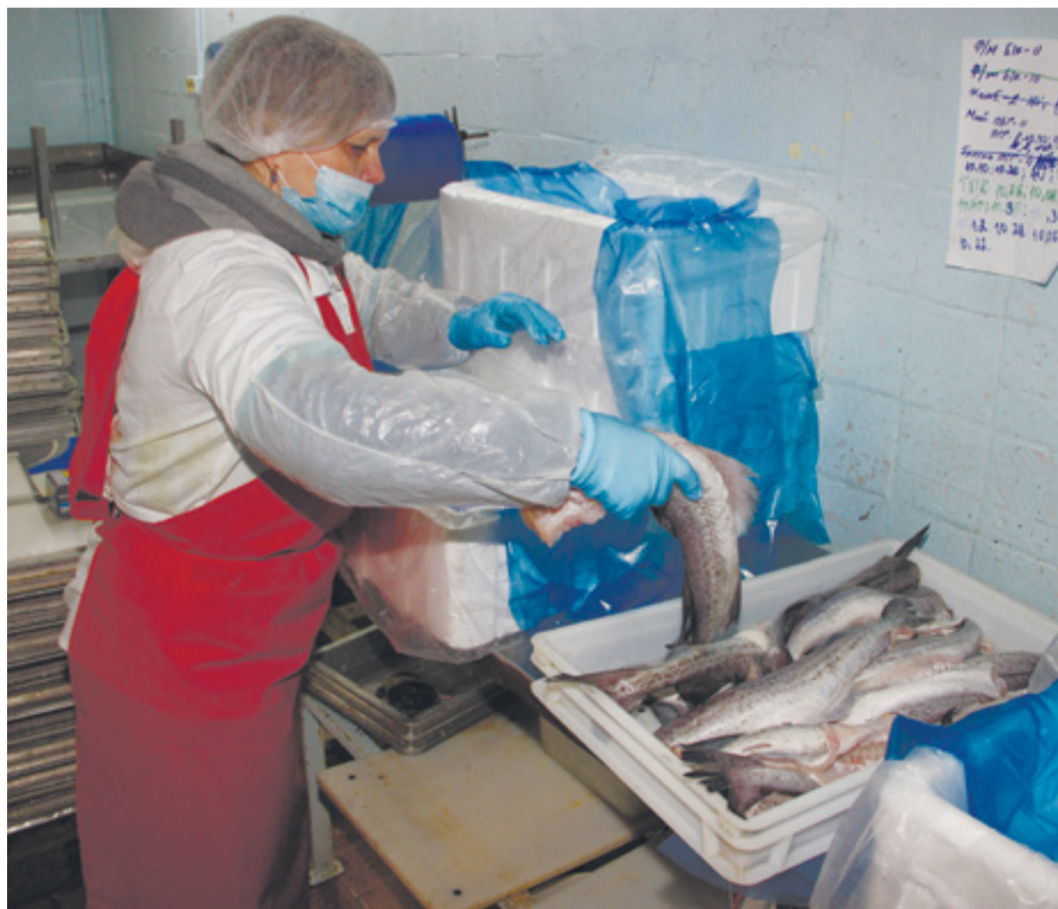
▲ В этой упаковке продукцию доставят в Москву