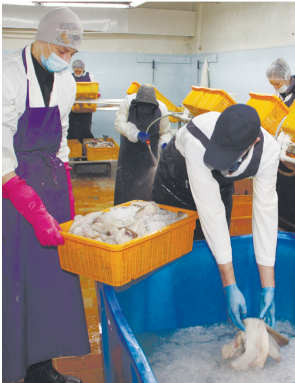
▲ Рыбу охлаждают в смеси из воды, льда и варекса