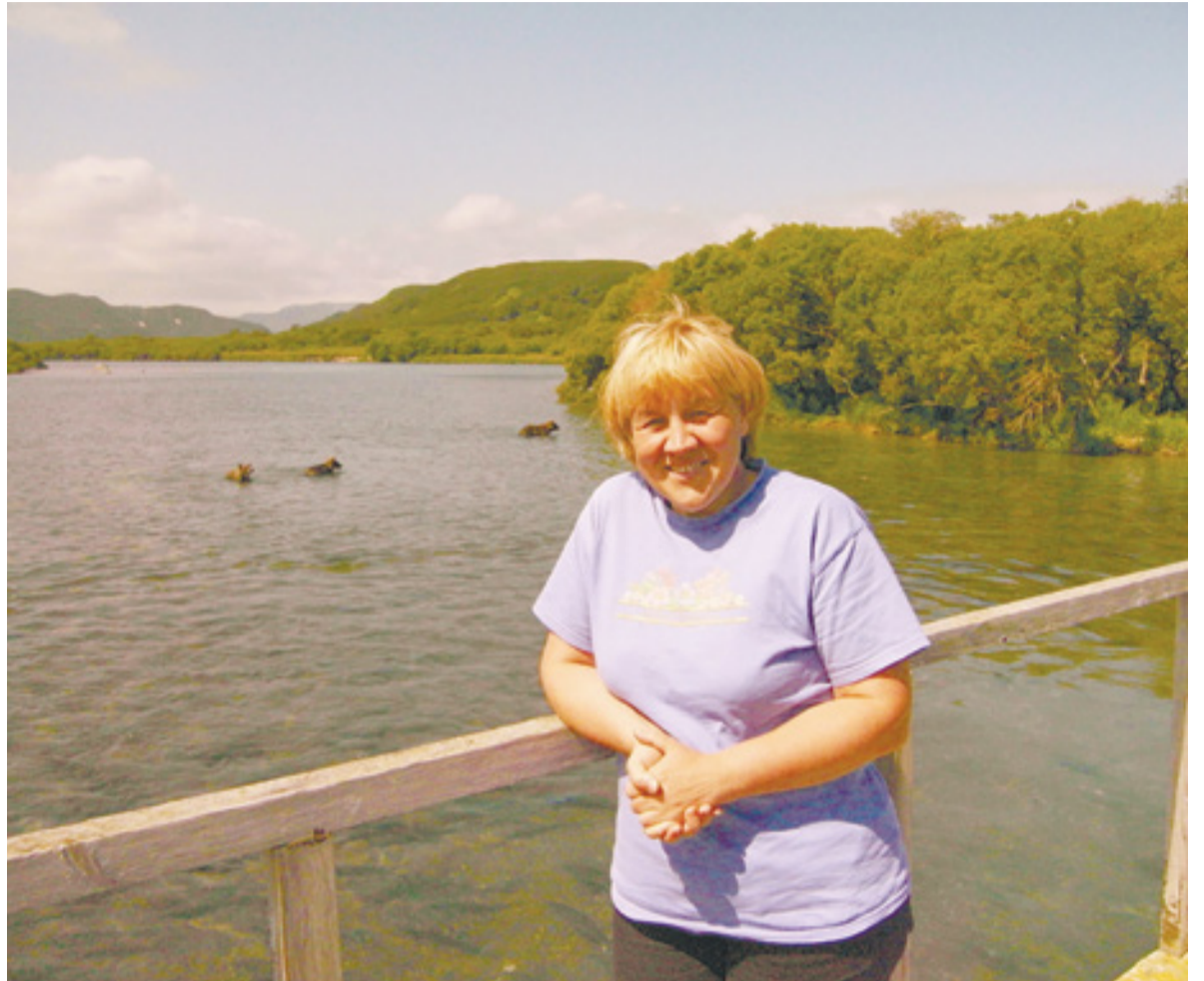
▲ На Курильском озере

«Я влюбилась в Камчатку с первого взгляда, но впечатления были двойственными. Помню, выходишь на морской берег и сразу чувствуешь всю мощь и величавую красоту Тихого океана, а потом оборачиваешься – по всему берегу видишь массу «прелестей» человеческой цивилизации – заброшенные строения, старые суда. И люди – добрые и искренние, но с психологией временщиков, сидящие на чемоданах. Тогда на полуостров почти каждый приезжал на время, чтобы заработать и вернуться в родные края. Но судьба многих складывалась совсем иначе. Спрашиваешь, сколько уже вот так временно здесь живете, ока-