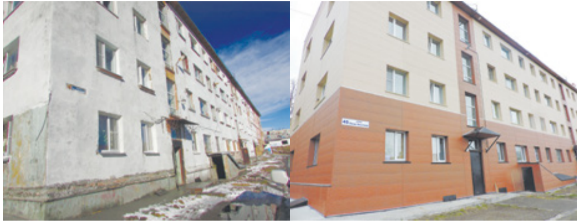
▲ До и после капремонта

В доме № 45 на ул. Петра Ильичёва был выполнен капитальный ремонт крыши, фасада и системы электроснабжения. Однако компания, управляющая данным домом, неоднократно направляла письменные претензии в адрес фонда относительно качества проводимых и проведенных работ