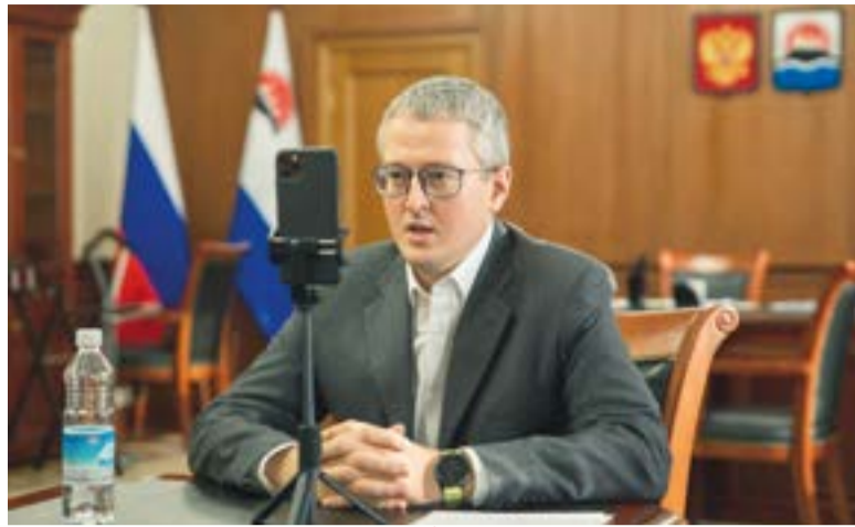
▲ Владимир Солодов

Владимир Солодов был назначен временно исполняющим обязанности губернатора нашего края 3 апреля. Главный вопрос, которым ему пришлось заниматься с первого дня, – эпидемическая ситуация на Камчатке