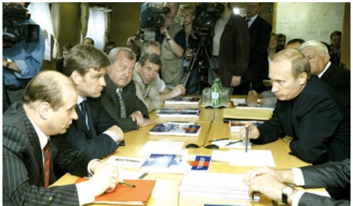
Июнь 2004 года, БМРТ «Арчер». После этой встречи начались реформы в рыбной отрасли

– То есть для вас самое главное – это закрепленные акватории?