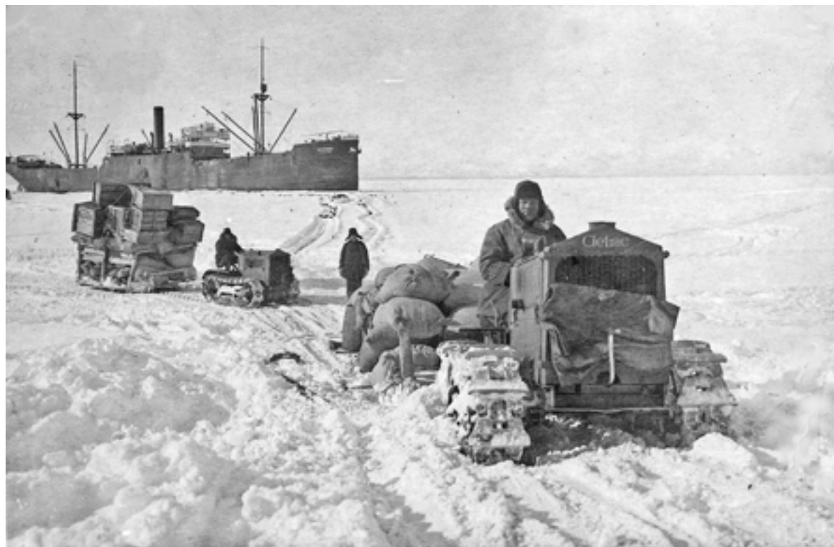
▲ Выгрузка товара с парохода АКО «Орочон» на лед Авачинской губы, 1930.

Один из делегатов предложил заведующему столовой купить это самое ситечко, дабы «не попадал таракан в стакан и не портил людям настроение». Да и заведующему городской пекарной следовало обратить серьезное внимание на качество выпускаемого хлеба, «который собаки кушать не будут» и от коего «даже заболевают делегаты». Вот такая незавидная участь досталась столь уважаемым людям из-за халатности отдельных работников. О том, возымели ли действие делегатские слова, нам неизвестно.