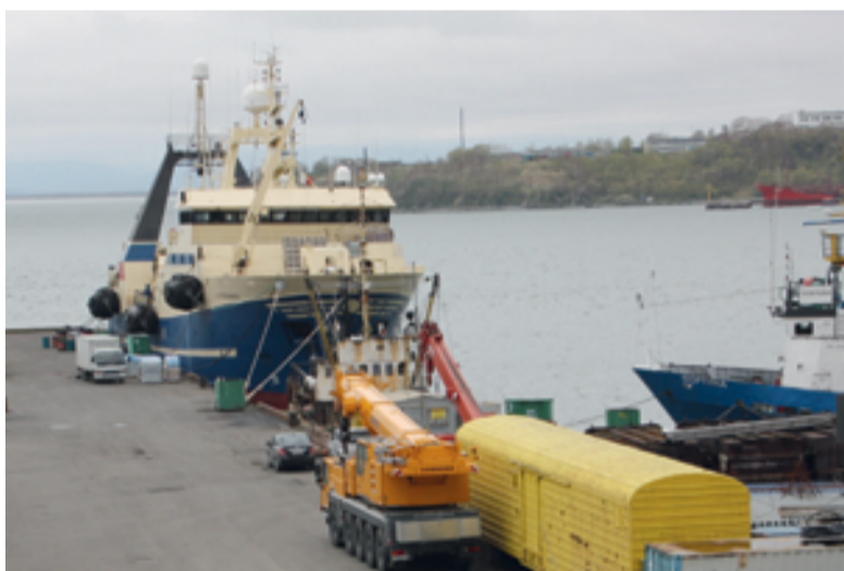
▲ ООО «Терминал «Сероглазка». Создание порта-хаба перевалки контейнерных грузов

В-третьих, данный режим не предполагает реализацию инвестиционных проектов только в портовой деятельности. Потенциальные