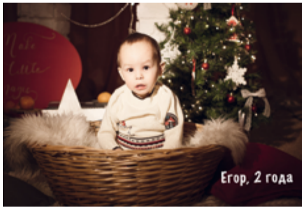
Егор, 2 года