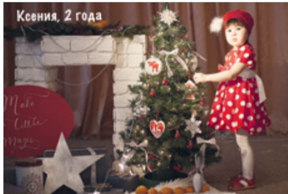
Ксения, 2 года