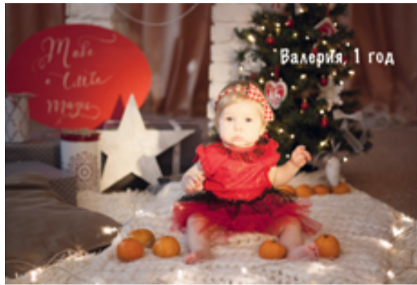
Валерия, 1 год