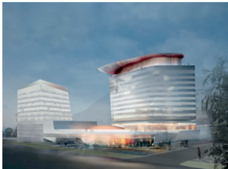
▲ ООО «Новый дом». Строительство отеля в г. Петропавловске-Камчатском

Это в первую очередь налоговые льготы в течение 10 лет, сниженные ставки на страховые взносы до 7,6%, режим свободной таможенной зоны, устанавливающий в том числе нулевые ставки по таможенным платежам на оборудование и строительные материалы. Кроме этого, данный механизм позволяет резидентам получить в аренду