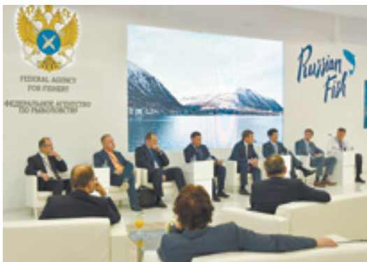
▲ Оргкомитет форума

Оргкомитет утвердил даты форума – с 14 по 16 сентября – и площадку: это выставочный комплекс