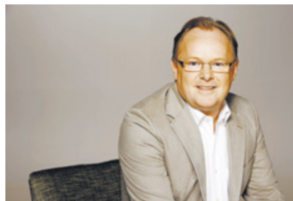
▲ Министр рыбного хозяйства Норвегии Пер Сандберг

Он обратился к отраслевым ассоциациям с просьбой привлечь зарубежных партнеров к участию в