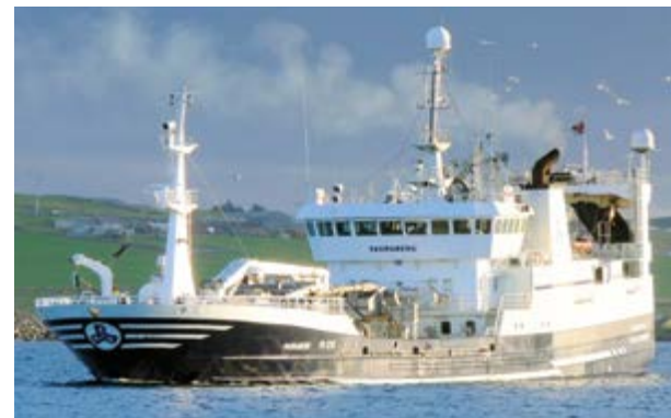
Фарерское судно Fagraberg проводит испытания трала «Атлантика-2600»