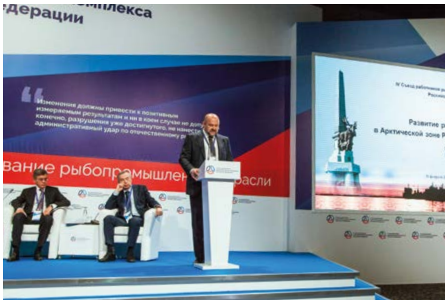
Губернатор Архангельской области Игорь ОРЛОВ

знали этот процесс справедливым, понятным и прозрачным».