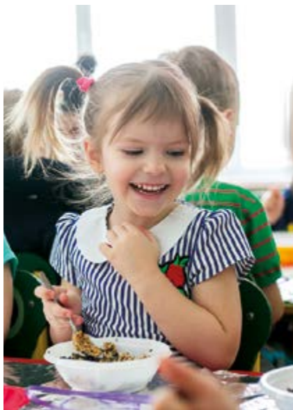
Фонд берет ответственность и за совсем юных сахалинцев и курильчан