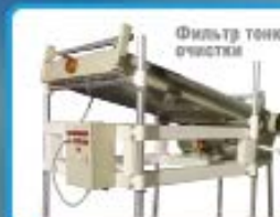
Фильтр тонкой очистки