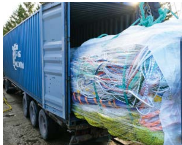
Отправка продукции на Дальний Восток