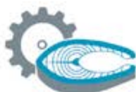
переработка рыбы и морепродуктов