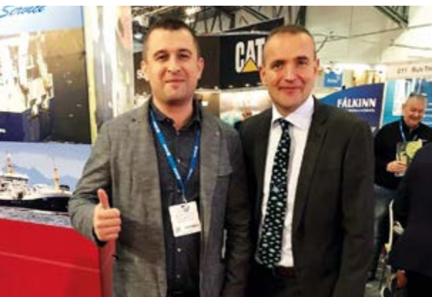
Дмитрий ФЕДОРОВ и президент Исландии Гвюдни ЙОУХАННЕССОН

1998-1999 годы – первое серьезное расширение штата компании.