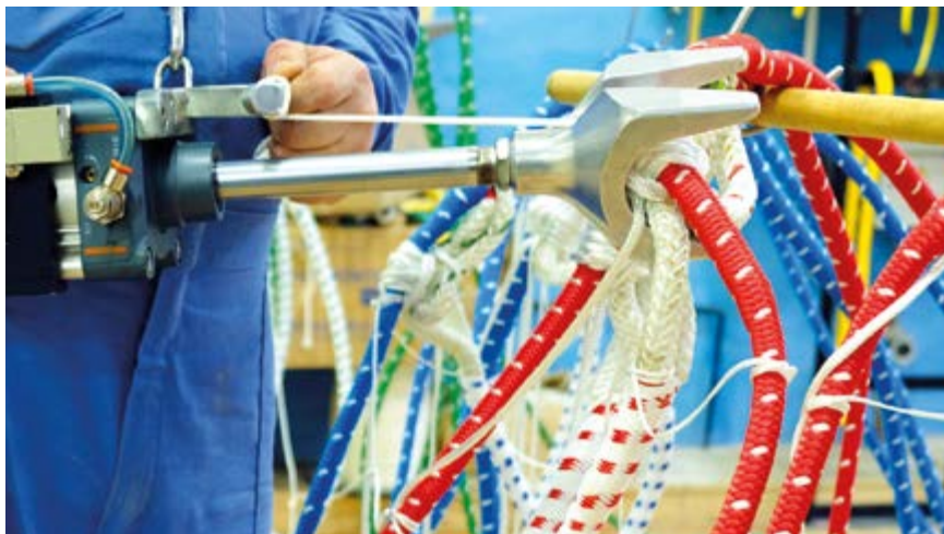
Усиленные тралы готовятся для поставки на промысел в ледовых условиях