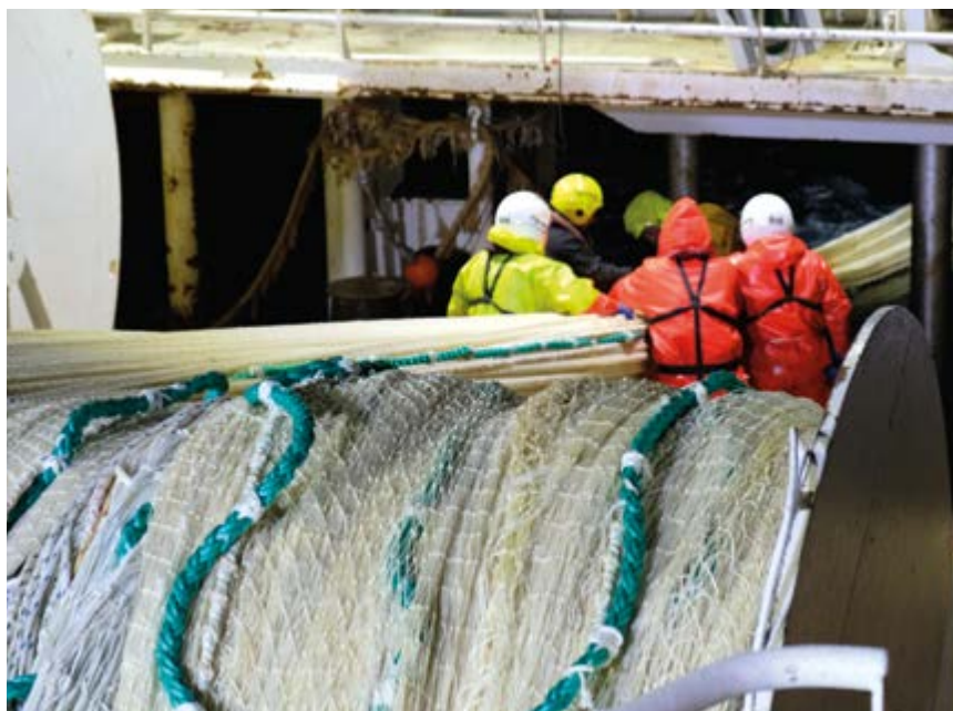
Трал «Атлантика-2600» на промысле