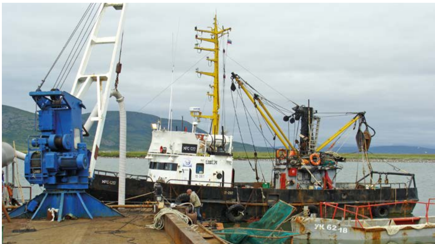
Убрать избыточные барьеры по учету улова Камчатка предлагает для всего Дальнего Востока

учет улова, полагают сторонники изменений. Среди плюсов называют и получение объективных данных о состоянии водных биоресурсов.