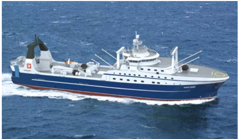
РРПК подписала контракт с российскими верфями на строительство шести супертраулеров под инвестквоты. Рассматривается вопрос увеличения серии до восьми судов

– На отраслевых выставках РРПК представила новую торговую марку Nordeco. Выход в розничный сегмент – это часть стратегии компании? На-