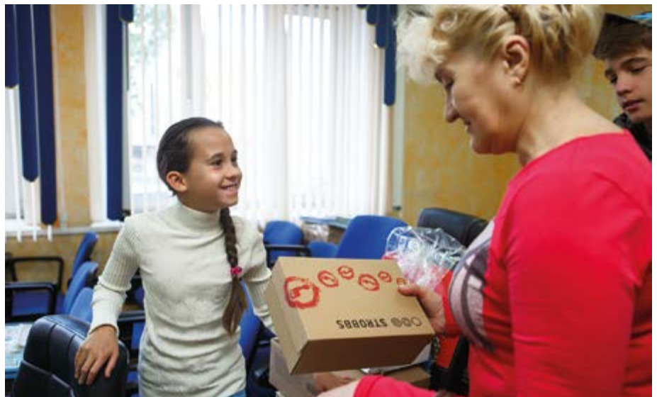
Связь поколений – это воспитание лучших чувств и одновременно поддержка тех, кому это действительно нужно

В этом году «Родные острова» открыли грантовую программу для некоммерческих организаций и активных граждан. Заявки принимаются на гранты для развития спорта, поддержки талантливых детей и молодежи, помощи гражданам в тяжелой жизненной ситуации. Внедрение грантовой программы позволяет фонду расширить каждое направление. Так, для проектов в области спорта вводится отдельная тематика – адаптивный спорт для людей с ограниченными возможностями.