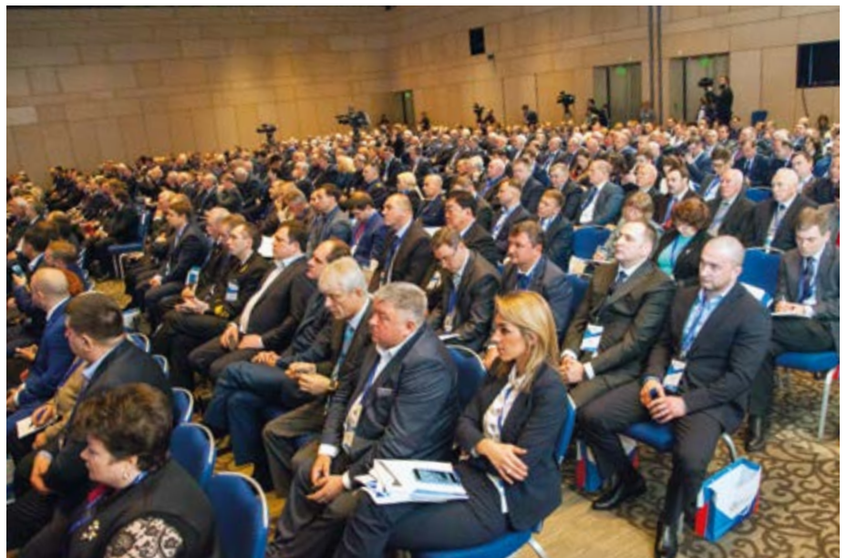
Более 300 делегатов приехали в Москву

По словам Аркадия Дворковича, Минсельхоз и Росрыболовство «в самые ближайшие дни завершат работу над всеми документами». Вице-премьер выразил на-