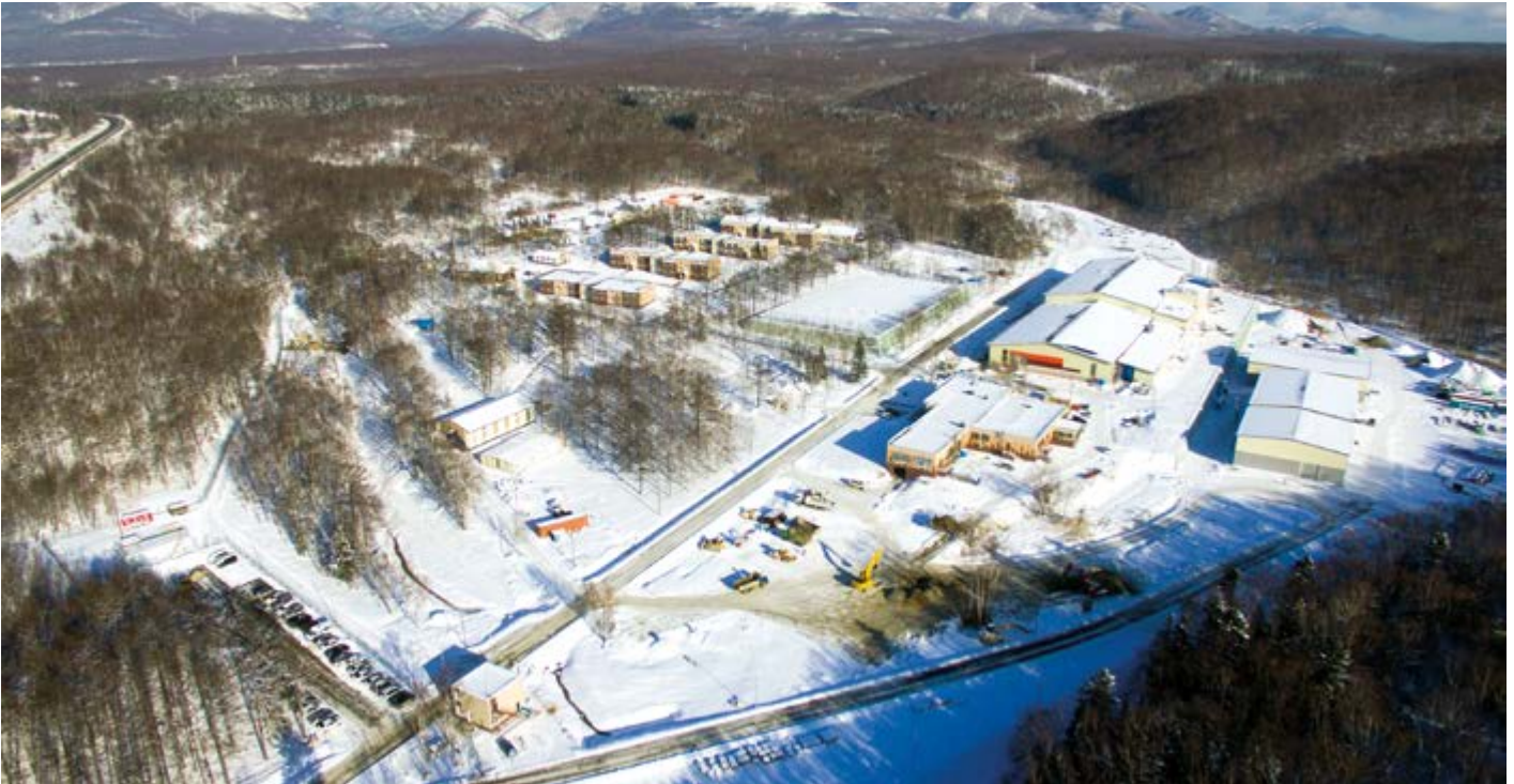
Учебно-тренировочный центр «Восток»

ников игр «Дети Азии» в 2019 году. Уже в текущем году планируется сделать комплекс площадкой всероссийского чемпионата рабочих профессий World Skills Russia.