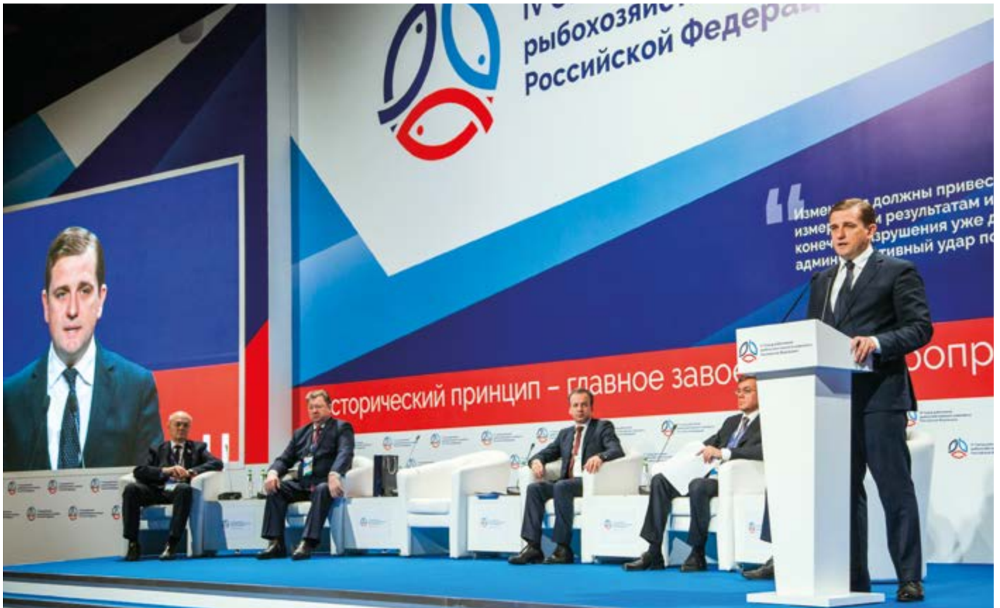
Руководитель Росрыболовства Илья ШЕСТАКОВ

О важности сохранения исторического принципа с трибуны съезда заявили отраслевые ассоциации и предприятия Дальневосточного, Северного, Западного, Азово-Черноморского и Волжско-Каспийского бассейнов. Рыбаков поддержали депутаты Госдумы и члены Совета Федерации, руководители судостроительных заводов и губернаторы приморских регионов.