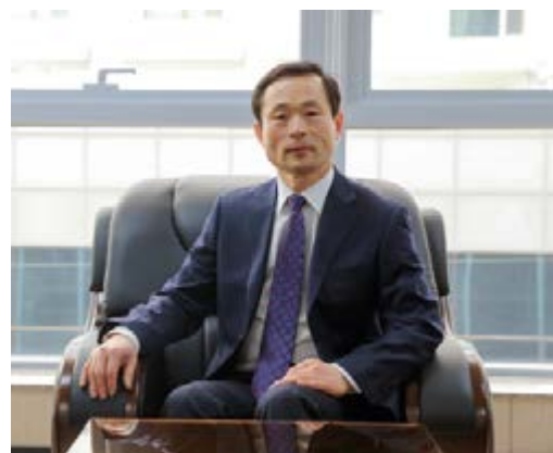
Президент группы компаний Пак Мун Хёк

Мы компания с лучшей инфраструктурой для судостроения и судоремонта в Корее. «Дэун» может предоставить любой сервис для российских судоходных и