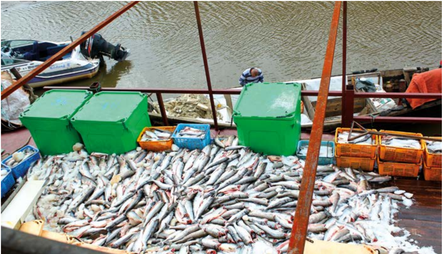
Лососевая путина на реке Амур

изначально за Ульчским районом, достался соседнему Николаевскому району только потому, что тот, благодаря географическому преимуществу, первым выбрал свои объемы и был готов продолжать промысел. При таком раскладе, по сути, вновь получится олимпийская система, которая на реке неприемлема.