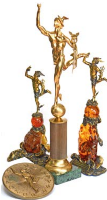
Награды лучшему предприятию-экспортеру

Мы поступательно двигались в этом направлении и в конце концов получили тот комплект, которого, кроме нас, нет ни у кого в мире. Эти материалы обеспечили нам то звучание канатных частей, которое очень нравится рыбе, и тот результат, который удивляет всех в мире. Мы в настоящий мо-