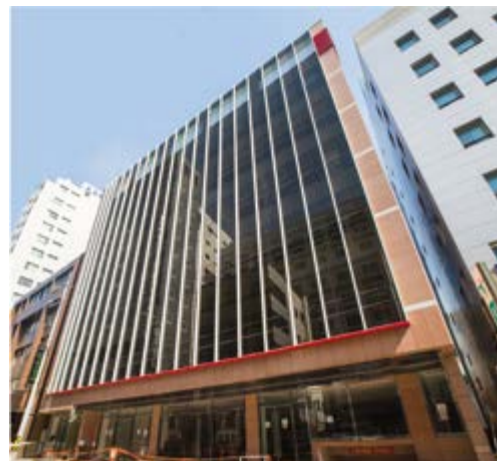
Головной офис группы компаний «Дэун»