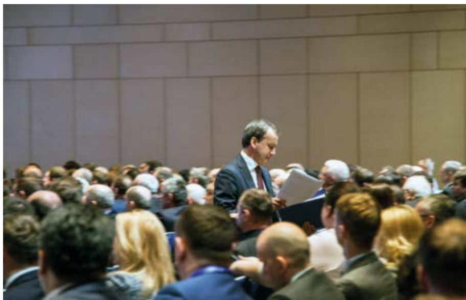
Выслушав главные доклады и ответив на вопросы рыбаков, Аркадий ДВОРКОВИЧ покидает съезд

Делегаты съезда говорили и о проблемах организации промысла на внутренних водоемах, об избыточных требованиях и непонимании специфики деятельности, с которыми сталкиваются предприятия аквакультуры. Это касается как вопросов формирования рыбоводных участков, в том числе морских, так и научного обеспечения работы рыбоводных хозяйств.