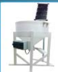
Кормушка Салмо Солар