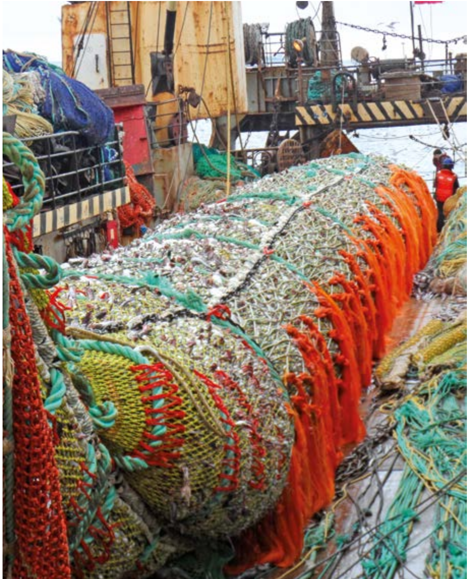
Под маркой Nordeco «Русская рыбопромышленная компания» предлагает рынку продукцию из филе минтая первичной заморозки

Я также уверен, что не бывает универсальных решений, одинаково эффективных для всего многообразия ситуаций. В любом правиле могут быть исключения, поэтому государство может решить, что для отдельных направлений нужен свой режим.