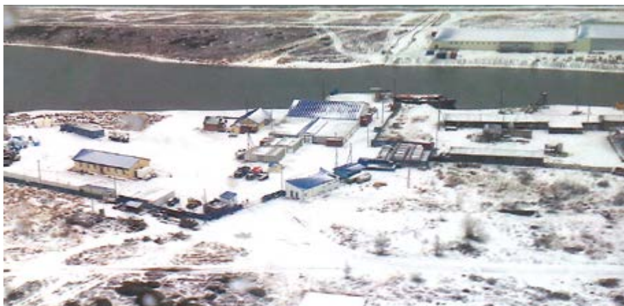
Завод в селе Ивашка Камчатского края станет уникальным береговым предприятием по производству рыбопродукции премиум-класса

Готовая рыбопродукция будет фасоваться и упаковываться в коробки, вес каждой на выходе составит ровно 20 кг. Причем внутри коробок будут