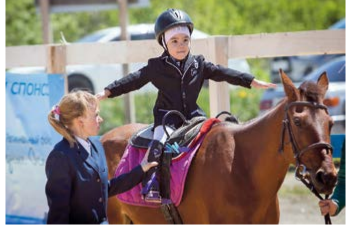
Большое направление в работе фонда – поддержка и развитие спортивных проектов Сахалинской области

Фонд «Родные острова» был создан в Сахалинской области в мае 2016 года. Его учредили – региональные компании рыбной отрасли: «ПРК», «КУК», «Монерон», «Аквamarin», «Севрыбфлот», «СТК», «Пристань», позже добавились и новые участники. Главными направлениями деятельности фонда были заявлены поддержка начинающих и профессиональных спортсменов острова, помощь детям, оказавшимся в сложной жизненной ситуации, поддержка одаренных детей. Эти планы «Родные острова» не замедлили воплотить в жизнь.