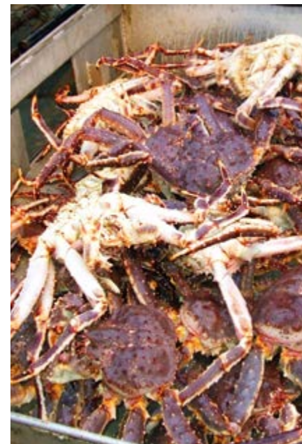
Российский промысел камчатского краба в Баренцевом море первым в мире получил сертификат MSC

как прилова при добыче других видов, а также показать, что эффективность системы управления промыслом крабов периодически оценивается как с помощью внутриведомственного рассмотрения, так и внешних экспертов.