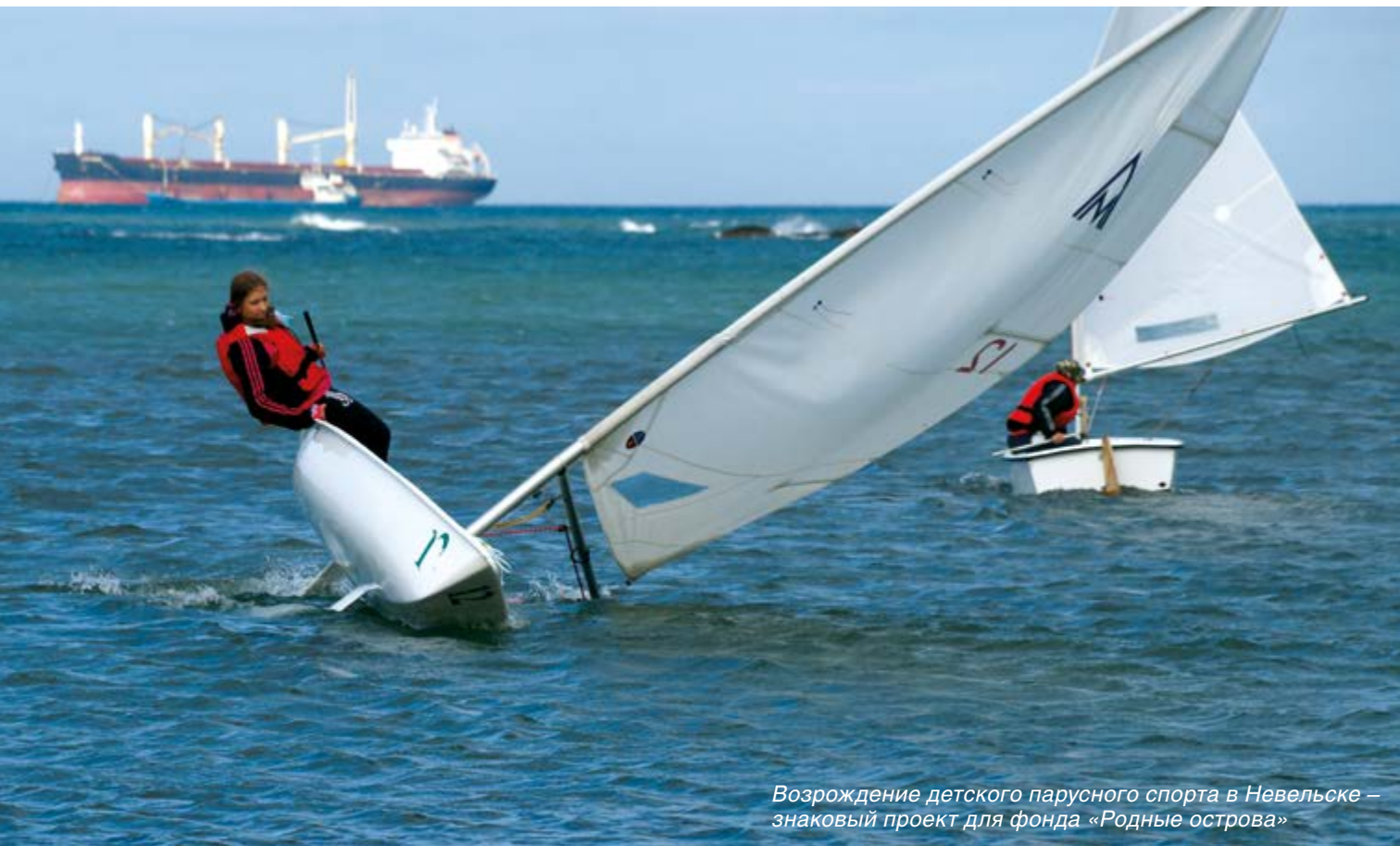
Возрождение детского парусного спорта в Невельске – знаковый проект для фонда «Родные острова»