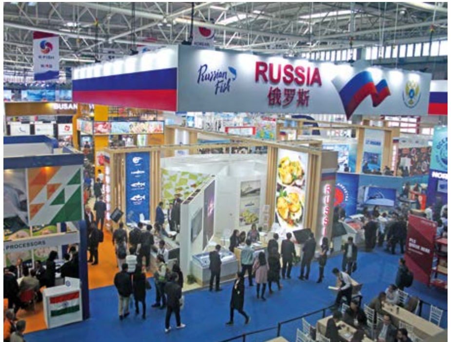
Российский стенд на выставке в Циндао (КНР)

Таким образом Expo Solutions Group постепенно отходит от практики простой продажи выставочных площадей, смещаясь в сторону комплексного маркетингового обслуживания. Углубленное изучение