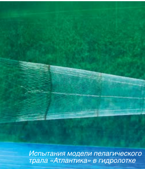
Испытания модели пелагического трала «Атлантика» в гидрлотке