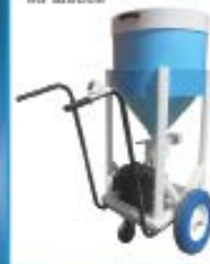
Кормушка передвижная полуавтоматическая на шасси