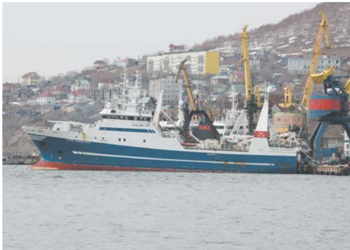
▲ СРТМ «Герои Даманского»

На «Героях Даманского» – слаженный экипаж из 60 человек. Процентом 70 – камчатцы. Еще 10 процентов – наши земляки, кото-