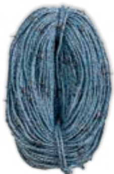
ХРЕБТИНА X С ВЕРТЛЮГАМИ ДЛЯ ОКЕАНИЧЕСКОГО ЯРУСНОГО ЛОВА

Хребтина производства компании Фисквегн сконструирована для обеспечения максимальной продолжительности эксплуатации промышленного вооружения, минимальный риск потери улова и последовательную уверенную выборку порядка.