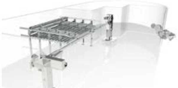
АВТОМАТИЧЕСКИЕ СИСТЕМЫ ЯРУСНОГО ЛОВА