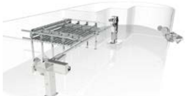
АВТОМАТИЧЕСКИЕ СИСТЕМЫ ЯРУСНОГО ЛОВА