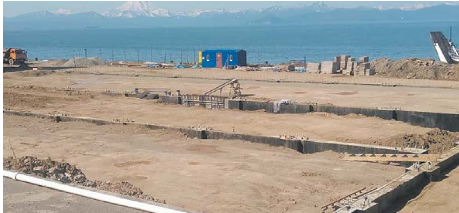
▲ Территория ООО «Камчаттралфлот», где реализуется проект компании

– Да. Мы и сейчас вылавливаем все квоты собственными судами. В компании три своих среднетоннажных судна (СТР). Кроме того, мы покупаем еще одно рыбодобывающее