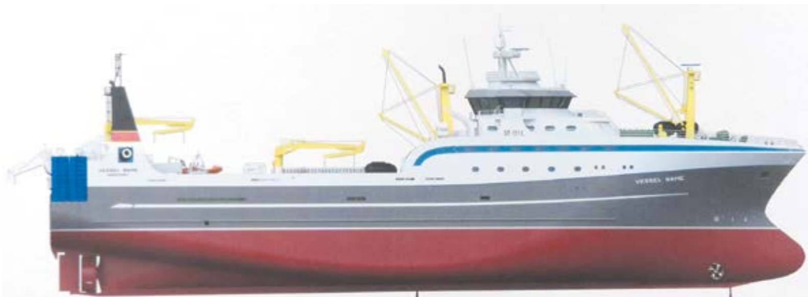
▲ Так будут выглядеть новые траулеры Океанрыбфлота