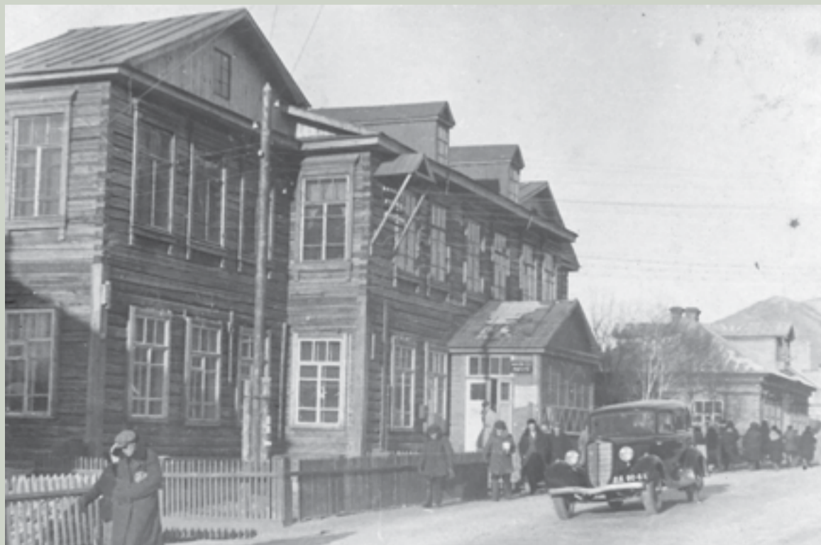
▲ Один из первых камчатских автомобилей на улице Ленинской, 1939 год

ков автомобильного транспорта за нелегкий труд, который всегда связан с огромной ответствен-