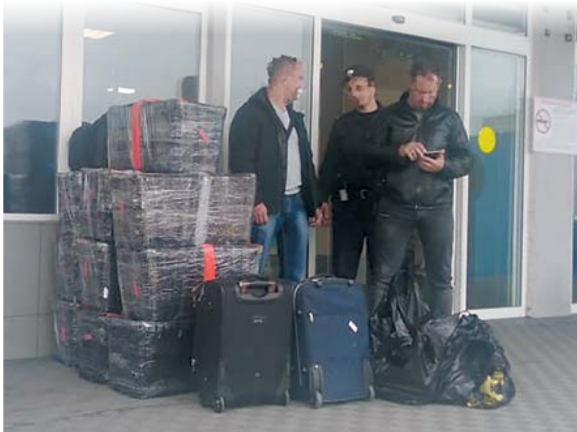
▲ Елизовский аэропорт. «Икрокурьеры» за работой – «толкают» контейнеры с икрой на самолеты

Рискнем предположить, что в почтовых посылках и в личном багаже с Камчатки браконьерской продукции уходит в разы больше.