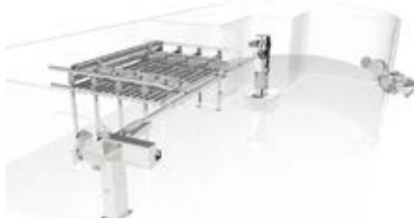
АВТОМАТИЧЕСКИЕ СИСТЕМЫ ЯРУСНОГО ЛОВА