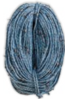
ХРЕБТИНА X С ВЕРТЛЮГАМИ ДЛЯ ОКЕАНИЧЕСКОГО ЯРУСНОГО ЛОВА

Хребтина производства компании Фискевегн сконструирована для обеспечения максимальной продолжительности эксплуатации промышленного вооружения, минимальный риск потери улова и последовательную уверенную выборку порядка.