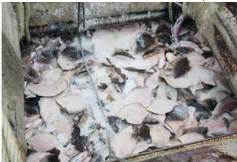
▲ Из-за действий капитан-лейтенанта выгрузка рыбы была задержана. В результате улов заleden и встал колом

просто стояло у причала, пока восточный ветер забивал бухту льдом. А значит, без помощи буксира сейнер уже не мог выйти в море (час работы буксира стоит 60 тысяч, а работы там на 4-5 часов). Работа была парализована.