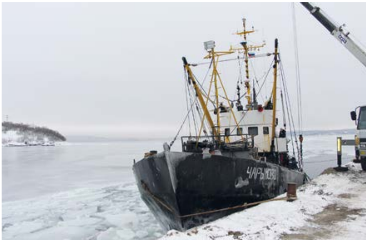
▲ РС «Чарымово»

Наведя на судне шмон, изъяв журналы и выписав капитану повестки, пограничники укатили. Экипаж остался в полном недоумении. Рыбу выгружать без журнала было нельзя, а без выгрузки судно не могло продолжить промысел. Оно