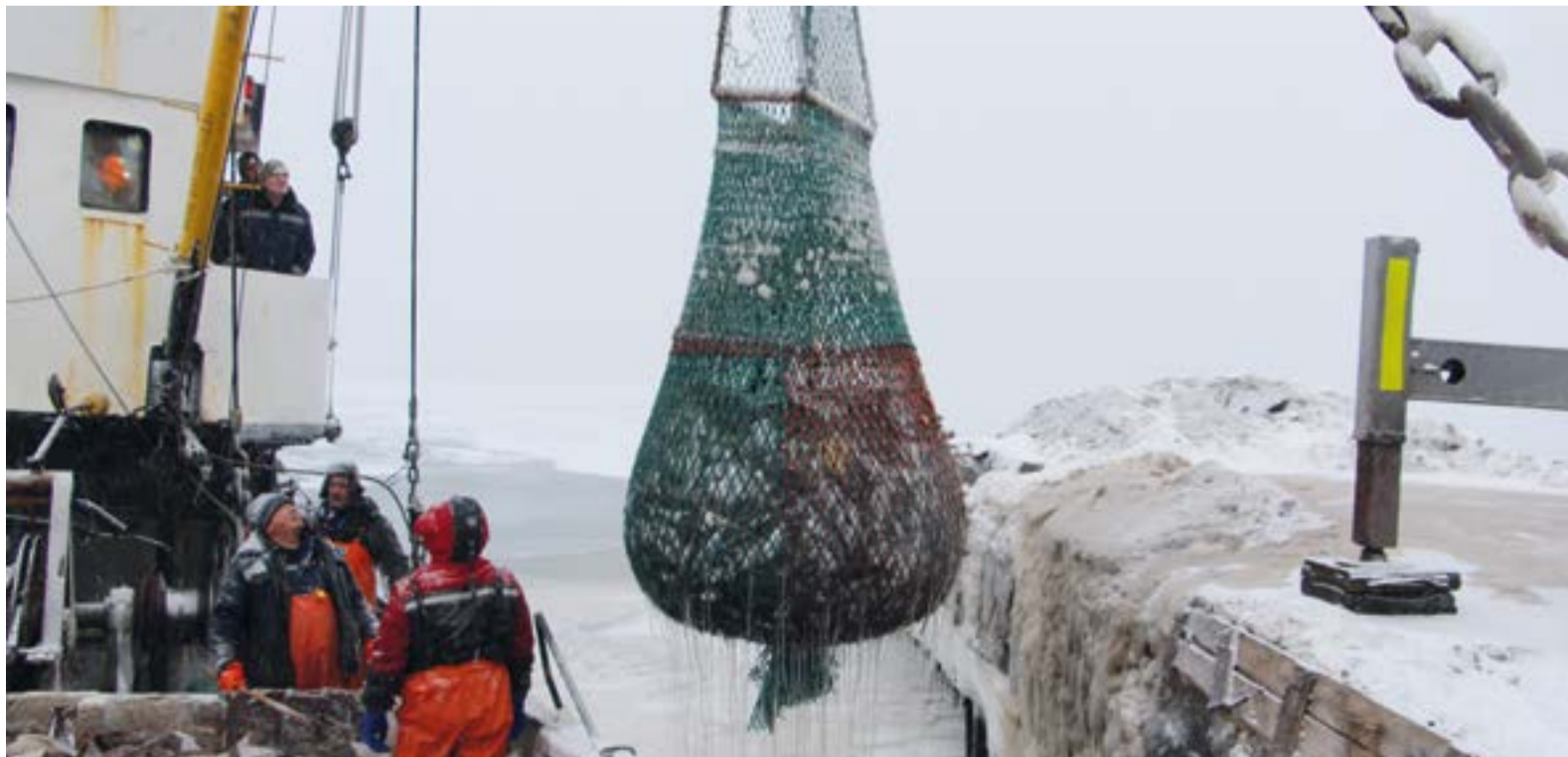
▲ С трудом рыбу выгрузили, но ее качество уже стало никаким

Конечно, будет обидно, если жители нашего края однажды совсем останутся без рыбы. Но не упрекайте рыбаков, которые откажутся везти улов на камчатский берег. Ведь на этом берегу их скоро не будет ждать ничего хорошего, а только аресты, обыски, спецназ. <