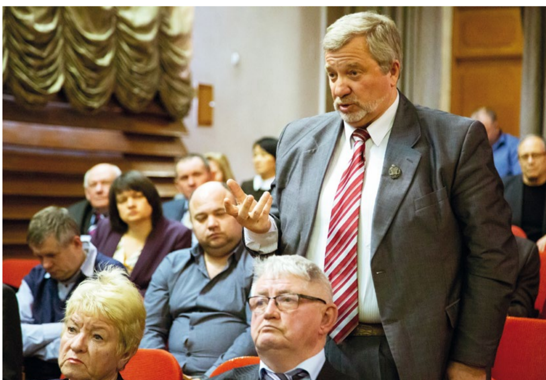
Рыбоводов беспокоит рост себестоимости продукции – из-за изменений налогового законодательства и повышения тарифов