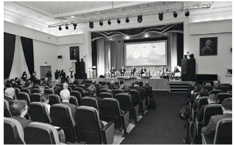
В Архангельске собрались представители 10 стран

Специалисты указали на температурные аномалии и тенденцию к миграции некоторых видов ВБР, например сайки или краба-стригуна опилио