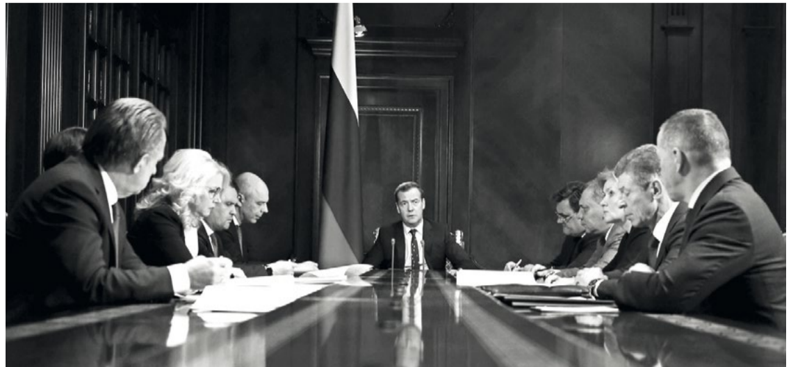
Дмитрий МЕДВЕДЕВ: Наша цель – избавить бизнес от избыточных и порой бессмысленных требований, это тысячи документов, зачастую они дублируют друг друга, противоречат друг другу

Сейчас КоАП, по словам премьера, «тяжеловесный, трудный». «Предприниматели просто не успевают фиксировать, что они нарушили в очередной раз, поэтому новый кодекс должен стать более компактным и более четким», – сказал председатель правительства.