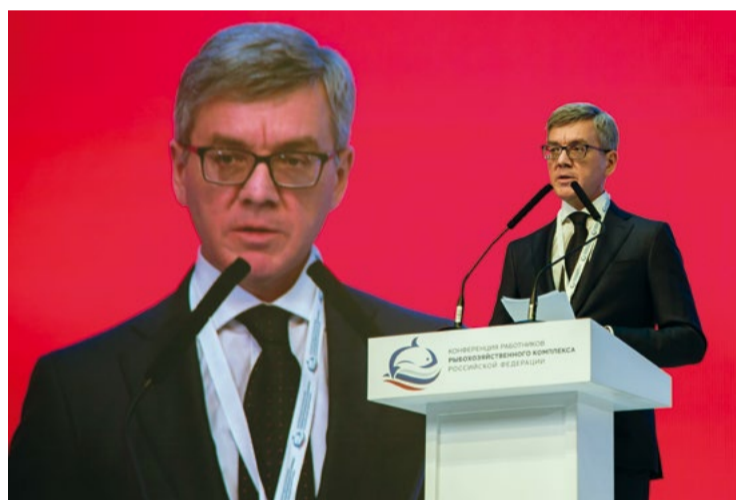
Президент ВАРПЭ Герман ЗВЕРЕВ