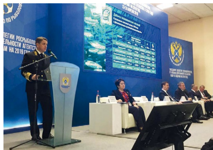
Руководитель Росрыболовства Илья ШЕСТАКОВ