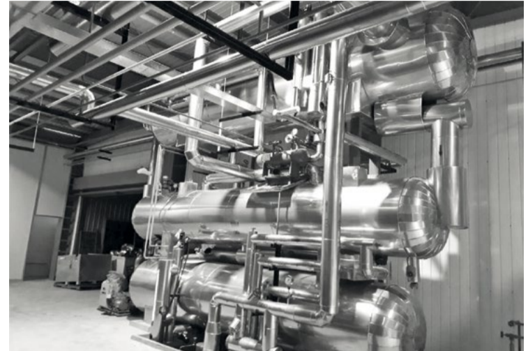
Каскадная CO 2 холодильная система, Тайвань

Заказчиков из Тайваня традиционно интересуют самые передовые и усовершенствованные технологии. И в минувшем году инженеры китайской госкорпорации реализовали для них проект по оснащению предприятия пищевой переработки каскадной холодильной системой с использованием углекислого газа в качестве хладагента. «В мире всего несколько компаний изготавливает подобные системы и занимается разработками в этой сфере. Среди них – Moon Tech, который, кстати, первым начал масштабное продвижение этой технологии в Китае, и уже 3-4 года с момента первых продаж большинство китайских предприятий пере-