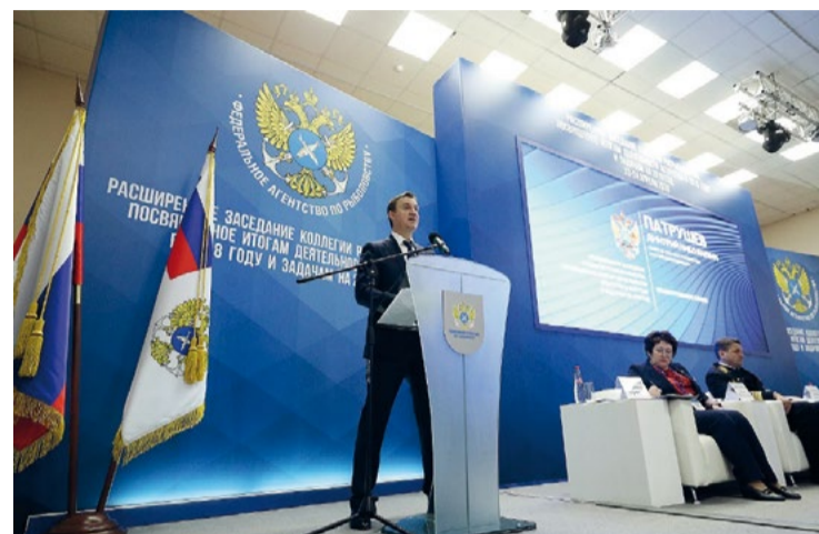
Министр сельского хозяйства Дмитрий ПАТРУШЕВ

Сальдированный финансовый результат организаций рыбной отрасли в действующих ценах составил практически 100 млрд рублей, на 22% больше показателя 2017 г. Отмечен рост прибыли организаций на 22,7% – более чем 100 млрд рублей.