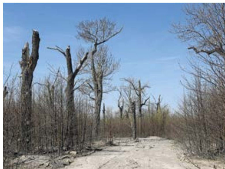
▲ Дорога к Шивелучу

Извержения с обвалом купола на вулкане Шивелуч происходили в 2005 и 2010