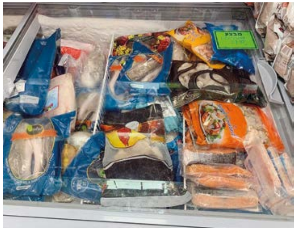
▲ В Израиле можно купить и мороженую рыбу, и свежую