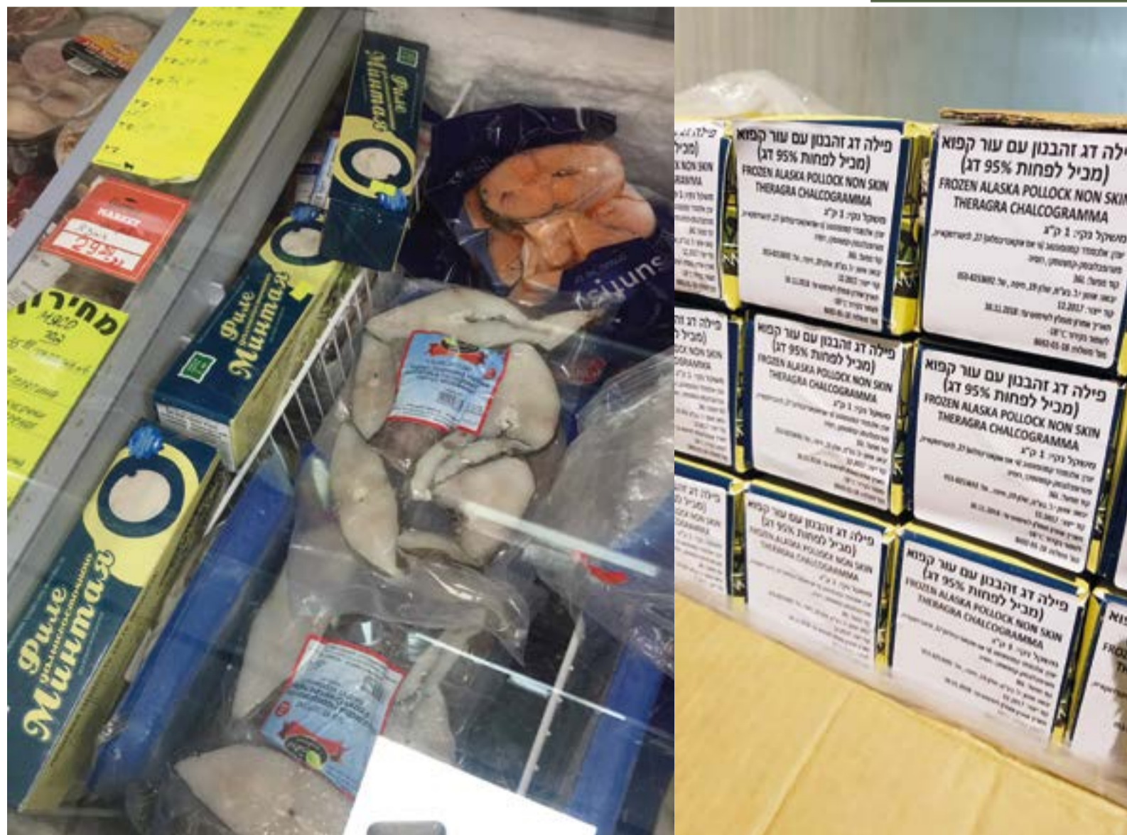
▲ Камчатский минтай – в израильском магазине

– Нет. Услуги по перевозке дешевле там, где потоки контейнеров