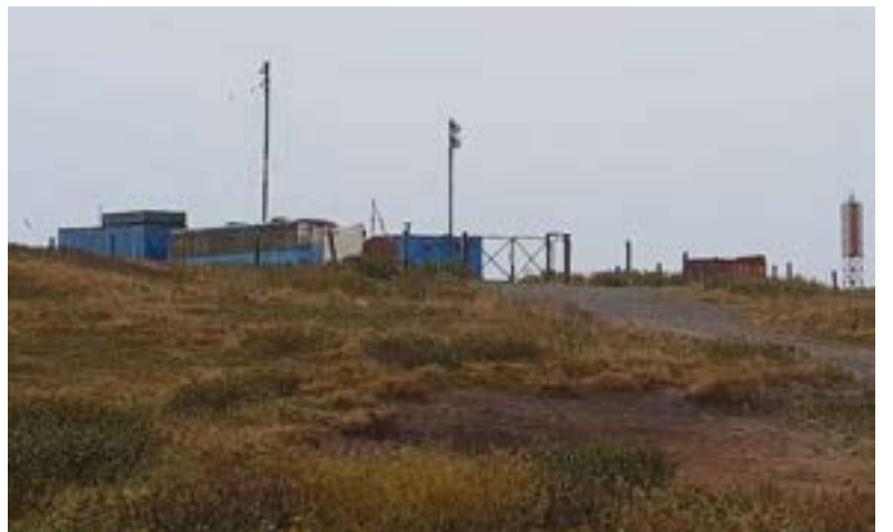
▲ Объект ГМССБ в п. Озерновском

В последние годы уделяется большое внимание антитеррористической безопасности объектов транспортной инфраструктуры и транспортных средств, в том числе морских. Тратятся большие деньги на усиленную охрану, видеонаблюдение, строительство ворот и заборов, металлодетекторы, тепловизоры, колючую проволоку и т. д. Сегодня в Петропавловске так просто не пройти ни в здание морского вокзала, ни на причалы бывшего рыбного порта. Но сильно озабочившись безопасностью зданий, сооружений и прочего имущества, государство подзабыло о безопасности людей, работающих в море. Увы, для наших моряков и рыбаков быть спасенными – это пока игра судьбы, но не право, гарантированное законом. А ведь по Конституции высшей ценностью у нас является человек, а не объект транспортной инфраструктуры. <