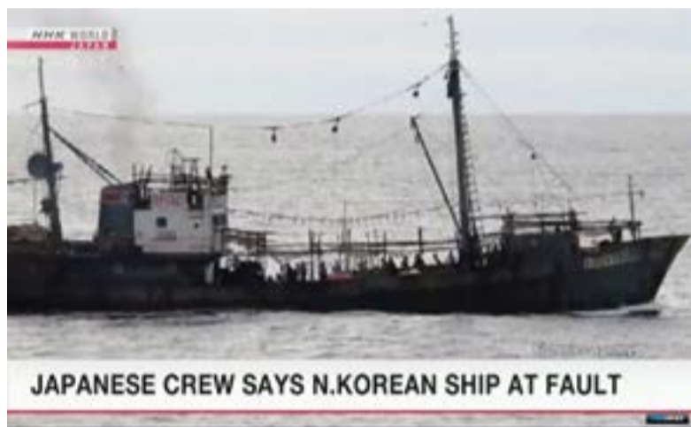
JAPANESE CREW SAYS N.KOREAN SHIP AT FAULT

проведена беспрецедентная и неожиданная операция силами пограничников ФСБ РФ. С убитыми, ранеными, арестованными судами и десятками захваченных товаров из КНДР.