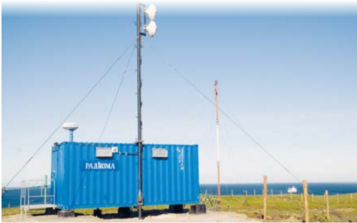
▲ Объект ГМССБ в п. Озерновском

Эта система создана международным сообществом, чтобы аварийный сигнал судна, попавшего в беду, был услышан сразу, где бы оно ни находилось. ГМССБ определяет четыре вида морских районов под литерой А и числом от 1 до 4. В каждом из них предусмотрено использование при бедствии определенных средств связи, которые обеспечивают здесь самую высокую надежность и оперативность. Значит, помощь тоже должна быть оперативной и гарантированной.