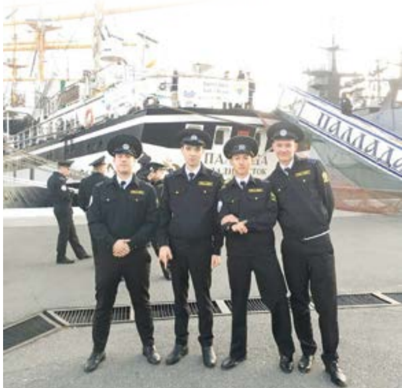
&gt; Окончание. Начало на стр. 1 &lt;

Во время экспедиции «Паруса мира» плавательную практику пройдут более 600 курсантов и около 60 юнг – школьников, которые направлены на парусники в рамках государственной программы от Фонда поддержки развития российского флота. Будут среди них и камчатские ребята. Сейчас на паруснике «Паллада» находятся в том числе курсанты Камчатского государственного технического университета.