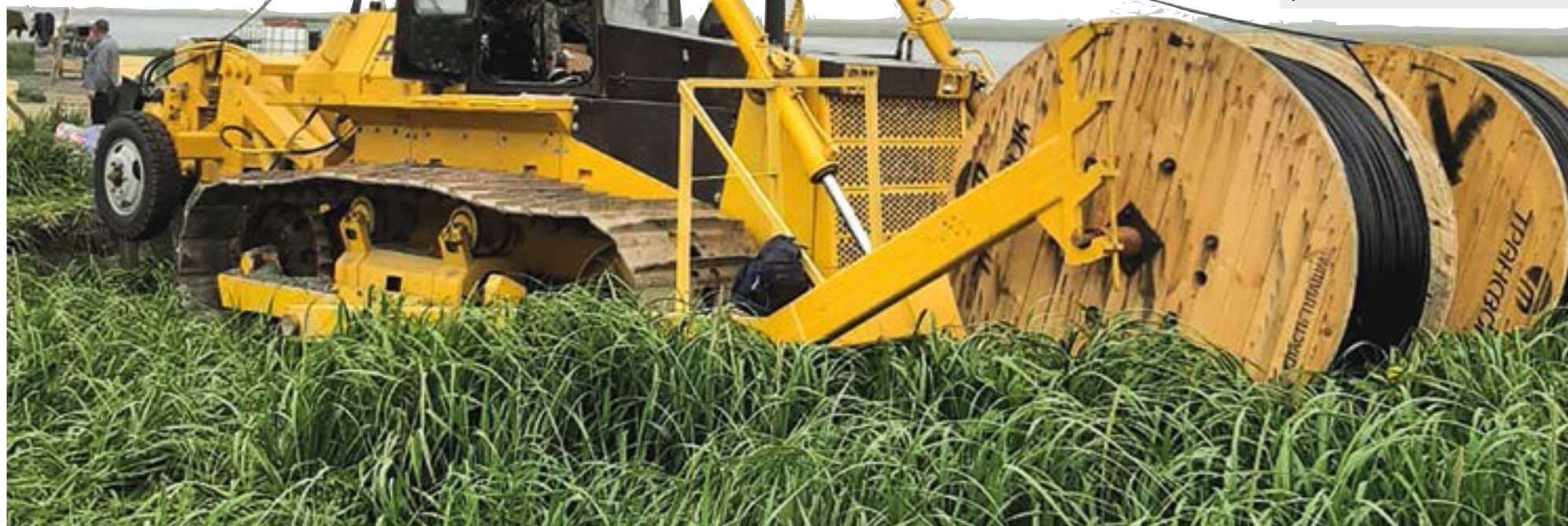
▲ Строительство магистральной ВОЛС в Усть-Большерецком районе

GPON (Gigabit passive optical network) – технология пассивных (энергонезависимых) оптических сетей, которая позволяет подключить абонента по персональному волоконно-оптическому кабелю – он заводится непосредственно в квартиру или частный дом. Это дает преимущество в пропускной способности по сравнению с другими технологиями, где оптика доходит только до дома, а внутри здания прокладывают обычный кабель. Технология GPON гарантирует высокую скорость передачи данных – более 100 Мбит/с – и устойчивый сигнал.