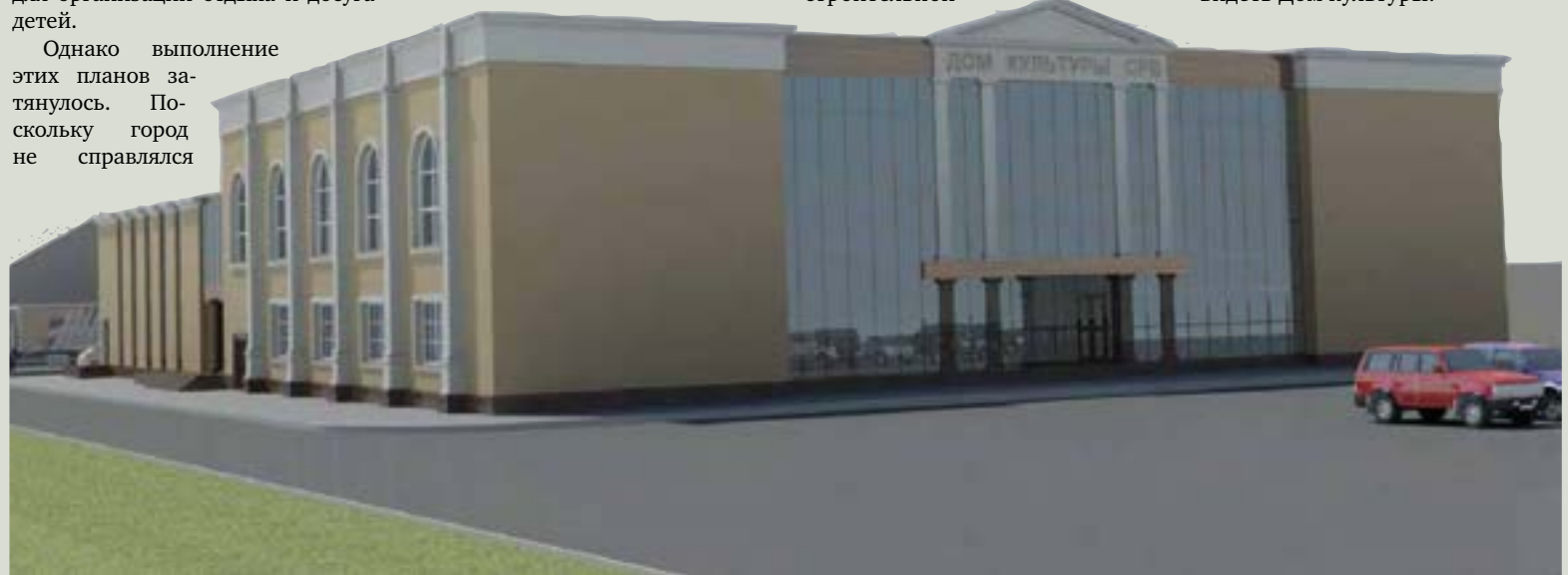
▲ Таким ДК СРВ станет после реконструкции

площадке, где ведутся работы по реконструкции ДК СРВ. Обсуждались дальнейшие работы и вопросы технологического подсоединения объекта к инженерным сетям. Губернатор поручил ответственным лицам до 20 марта подготовить свои предложения по проекту. Кроме того, он рекомендовал им встретиться с местными жителями и выслушать их мнение о том, каким они хотят видеть Дом культуры.