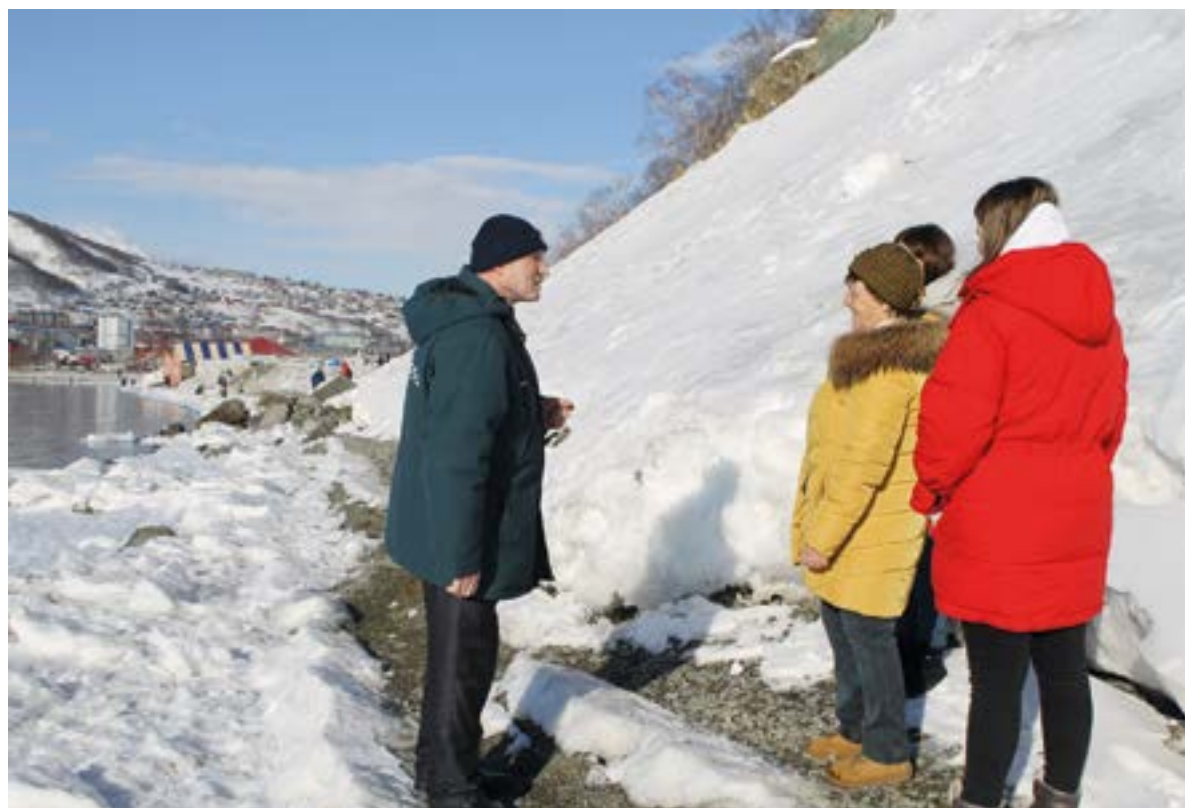
▲ Разъяснительная работа