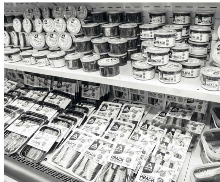
В 2019 году суда компании выловили порядка 6 тыс. тонн иваси, ориентир на 2020 год – более 30 тыс. тонн

Представитель «Антея» подчеркнул, что продукция завода в первую очередь рассчитана на внутренний рынок. Хотя интерес к иваси проявляется во многих странах – от Китая до европейских рынков и США. «К нам поступали такие