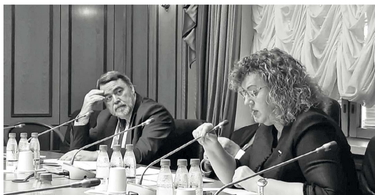
Руководитель ФАС Игорь АРТЕМЬЕВ: Сколько там этих денег, которые можно было бы получить, – на аукционах, на конкурсах...

«Важно обозначить это заранее, чтобы правила работы в отрасли были заблаговременно