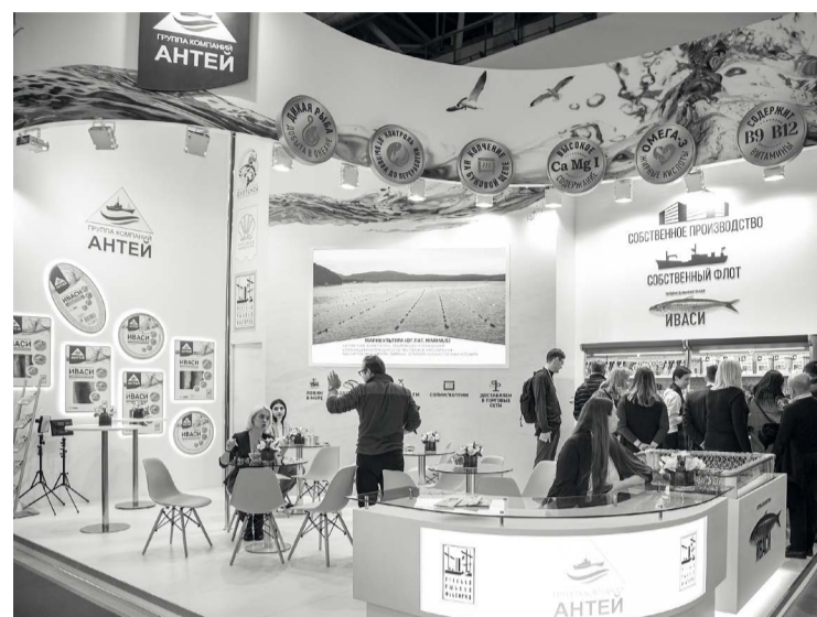
Стенд холдинга «Антей» на выставке «Продэкспо-2020» с расширенной линейкой филе иваси – уникального для российского рынка продукта

просто продать куда-то продукт, а понимать, где он потребляется, кем и в каком виде. Чтобы нам не было стыдно за рыбу, которую мы ловим, перерабатываем и реализуем», – объясняют в компании.