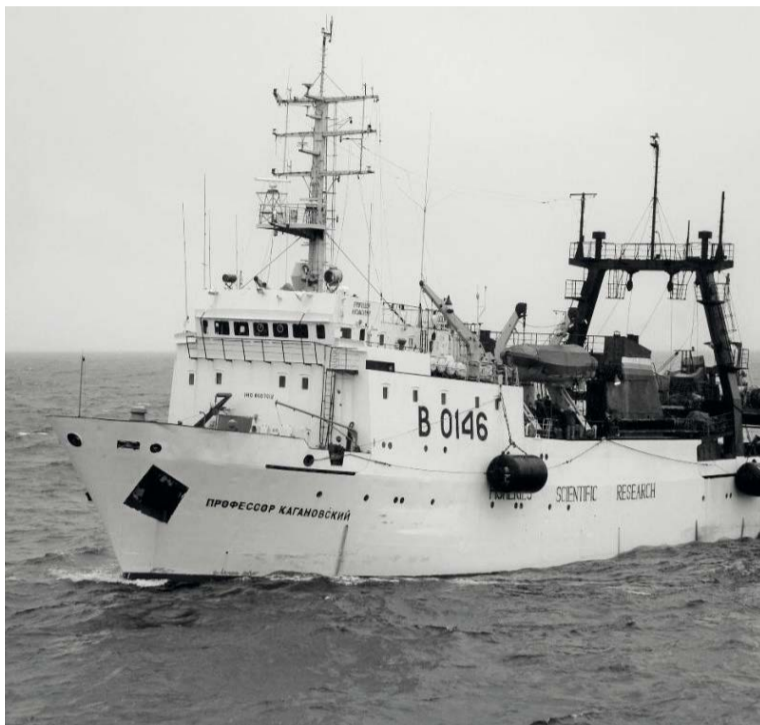
Полученная информация по лососям охотоморского бассейна будет оперативно использована для организации «красной» путины 2020 года

На втором этапе в начале лета специалисты выполнят траловые, гидрологические и планктонные съемки эпипелагиали тихоокеанских вод Курил и открытых вод северо-