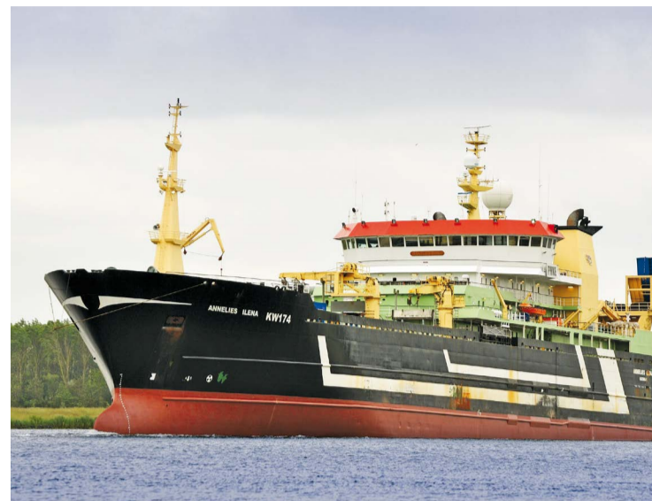
Голландский супертраулер Annelies Ilena использует тралы «Атлантика» с 2012 года

Калининградский гидролоток был сохранен силами компании «Фишеринг Сервис» – на нем провели восстановительный ремонт, а сейчас модернизируют. Специалисты рассчитывают, что благодаря ему в ближайшем будущем именно Калининград станет основным местом подготовки специалистов по промыслу. Это позволит избежать воз-