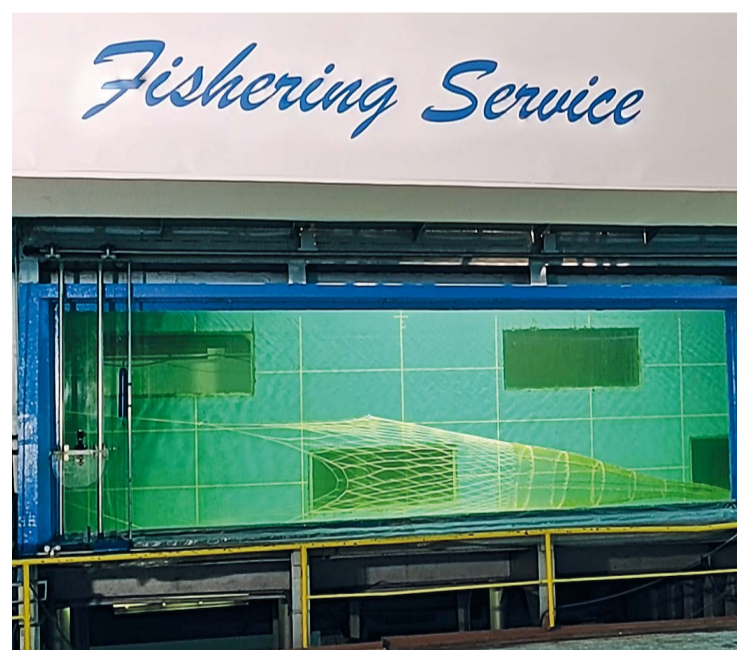
Для испытаний и демонстрации моделей промышленного вооружения «Фишеринг Сервис» восстановил гидролоток Калининградского МариНПО

можных трудностей из-за карантинных в странах Европы и даст возможность вновь использовать гидролоток для научных исследований и обучения студентов местных вузов.