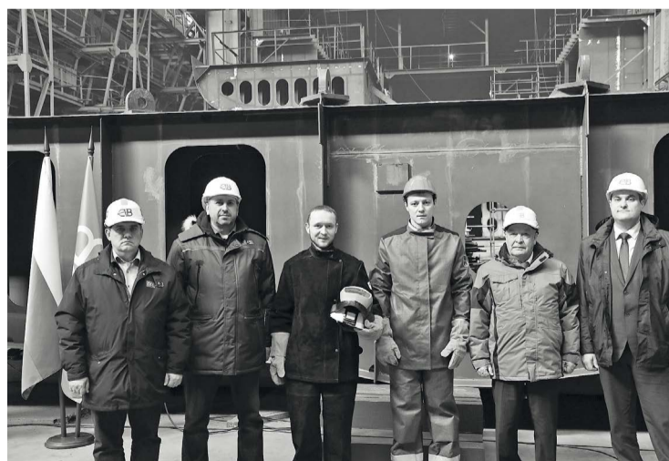
Церемония закладки нового траулера «Капитан Тузов»