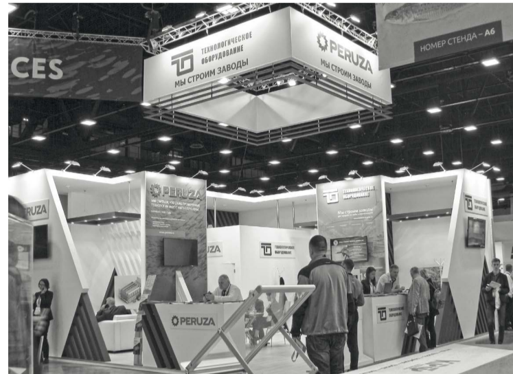
В этом году ситуация складывается таким образом, что Санкт-Петербург может остаться единственным плановым местом встречи международного рыбного бизнеса

Также свою продукцию и услуги представят Рыболовецкий колхоз им. В.И. Ленина, рыболовецкая артель «Наро-