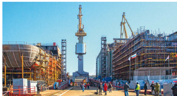
Серия судов строится на Адмиралтейских верфях

При этом в компании намерены не только уложиться в требования к локализации, по которым не менее 30% стоимости судна должно оставаться за российскими орга-