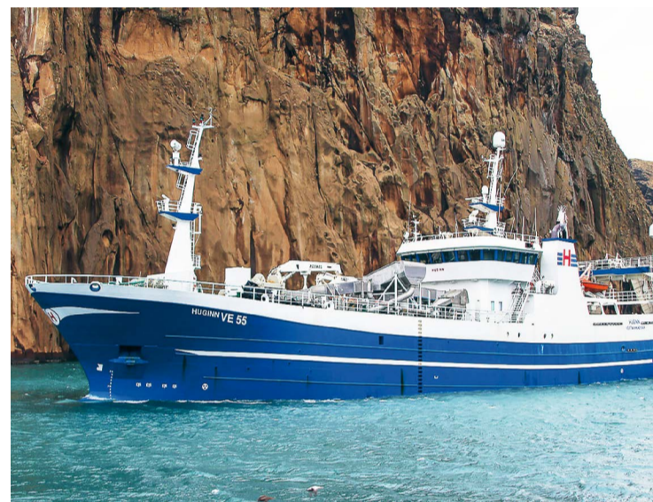
Траулер-сейнер Huginn – лидер на промысле скумбрии в Северной Атлантике