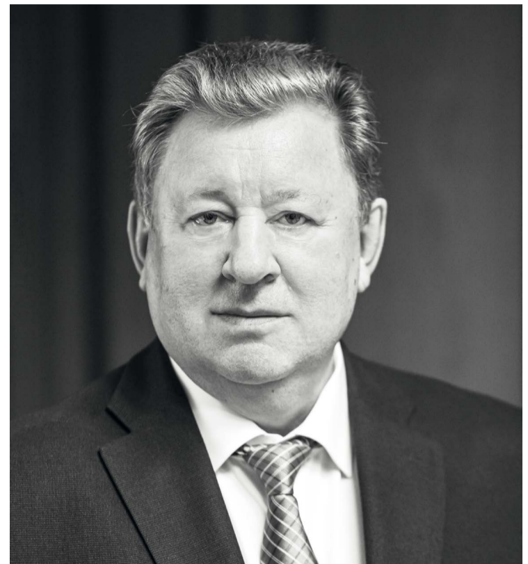
Владимир КАШИН, председатель комитета Государственной Думы по аграрным вопросам

По мнению депутатов комитета ГД по аграрным вопросам, которое поддерживается Минсельхозом России, Росрыболовством, а также всем рыбацким сообществом, только сохранение исторического прин-