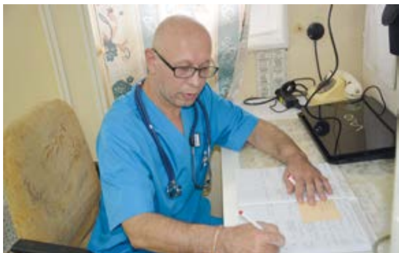
▲ Медики Океанрыбфлота – за работой