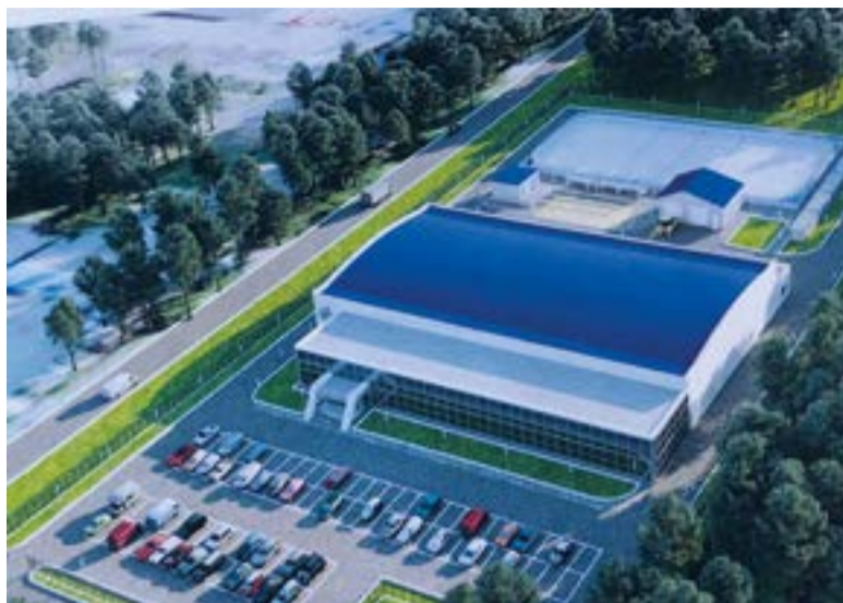
▲ По проекту «Вулкан» должен предстать нам таким

Плюс медицинский сектор и два спортивных зала. Один – функциональный, с тренажерами, сна-