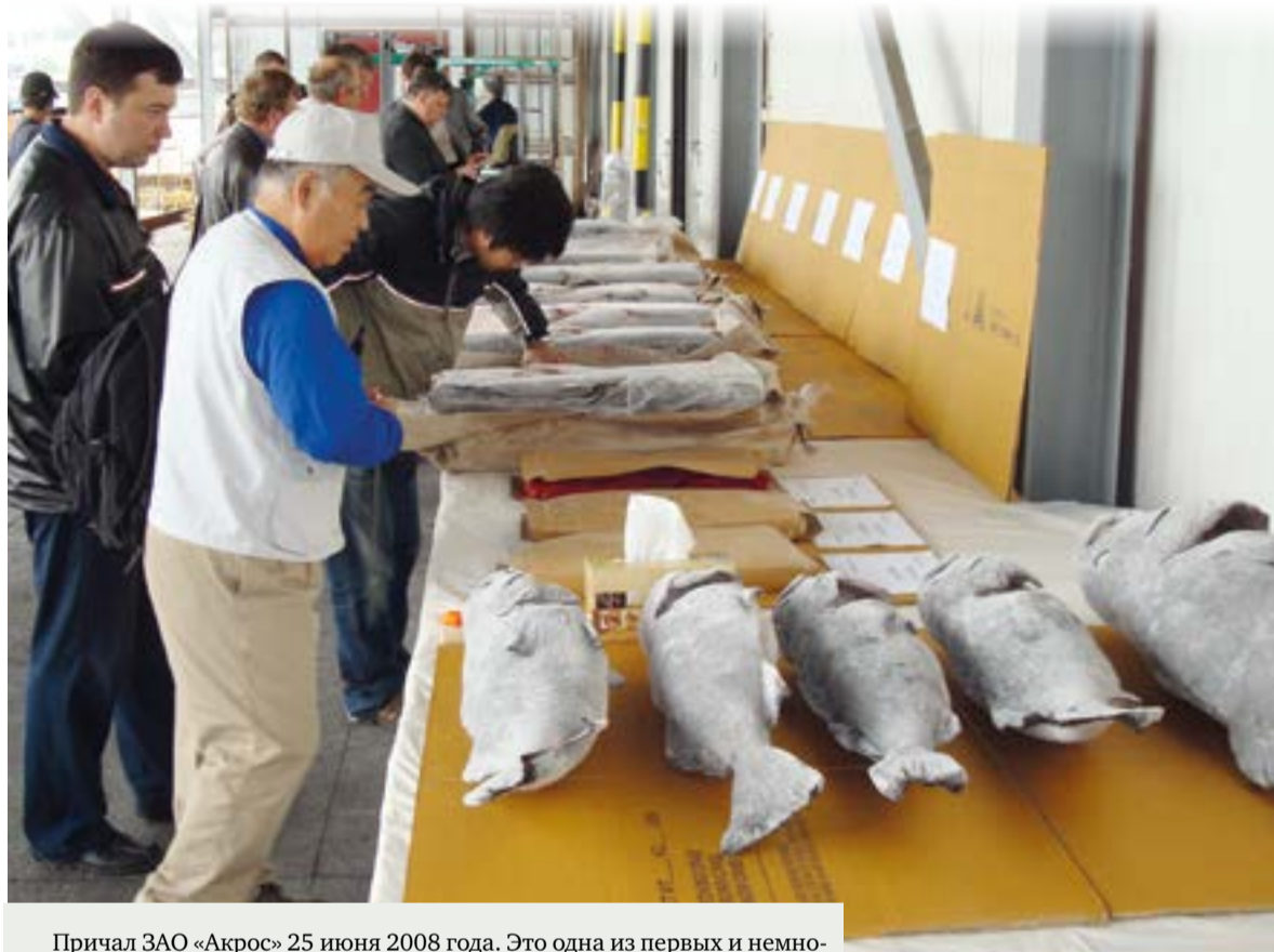
Причал ЗАО «Акрос» 25 июня 2008 года. Это одна из первых и немногих попыток организовать рыбные аукционы в Петропавловске-Камчатском. Делалось это так. В день выгрузки улова с судов на причал приглашались представители московских, приморских и японских фирм. Они знакомились с образцами продукции и до определенного времени должны были предложить свои цены. С тем, кто предложил наибольшую цену, заключался контракт. На продажу выставлялись нерка, икра нерки и рыба-монах.

Открытые аукционы расположены в охлаждаемом помещении размером с футбольное поле, которое находится в рыбном порту рядом с причалом. Все рыболовные суда, боты и прочие рыбацкие плавсредства вечером и ночью прибывают в порт, выгружают рыбу в ящиках со льдом. Сортирована рыба по видам, по размерам, по качеству. Так же выгружаются приловы, моллюски, членистоногие, головоногие моллюски, водоросли, кишечнополостные. В общем, все, что удастся поймать в донный трал, на перемет и другие разрешенные орудия лова. К 6 часам утра основная процедура выгрузки рыбы заканчивается, и в помещения допускаются потенциальные покупатели, которые смотрят, что им подходит по виду, по количеству, делают у себя в бумагах пометки, а в ящик кладут этикетку брокера, чтобы на торгах выкупить маркированный лот. Лот может быть размером от одного ящика до нескольких тонн. В 8.00 начинаются торги, которые длятся 1 час, после чего купленная рыба выкупается и грузится на транспорт. К обеду помещение аукциона уже пусто, и уборщики приступают к его уборке и подготовке к новому аукциону. Прелесть такого аукциона заключается в следующем.