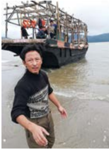
законного промысла, который осуществляется судами одной страны в

водах другого государства», – говорится в исследовании.