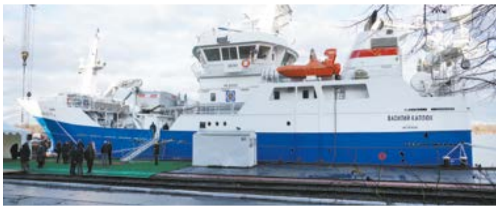
▲ Траулер «Василий Каплюк» в Калининграде