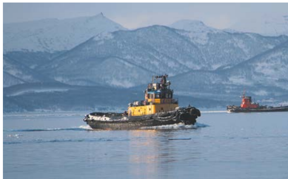
▲ Буксир «Суровый», «король бухты».

ним, шестым ребенком. Шустрым, пытливым. Рано познал труд. Родители детей воспитывали строго, что называется, два раза одно и то же не повторяли.