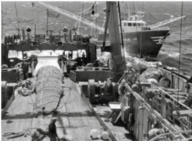
▲ Американский траулер доставляет свой улов на борт советского судна

СНАЧАЛА АМЕРИКАНСКИЕ РЫБАКИ ОТНЕСЛИСЬ К ВОЗМОЖНОМУ СОТРУДНИЧЕСТВУ С СССР НАСТОРОЖЕННО. НО ПОТОМ В США ОЦЕНИЛИ ВСЮ ВЫГОДУ ОТ ТАКОГО ПАРТНЕРСТВА