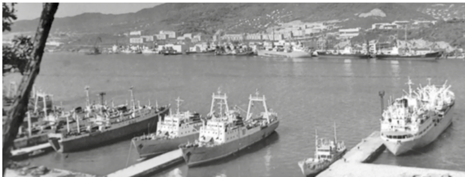
▲ Находка, 1978 год. Здесь находилось представительство советско-американского предприятия

С использованием материалов сайта «Рыба Камчатского края» и журнала Columbia: The Magazine of Northwest History