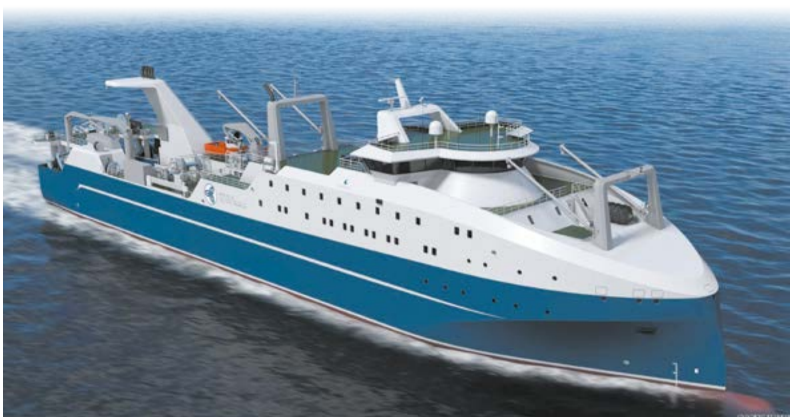
▲ Таким будет БМРТ «Виктор Гаврилов»

За месяц до Нового года в Калининграде произошли сразу два события, знаковые для рыбной отрасли нашего края. Судостроительный завод «Янтарь» передал камчатским рыбакам траулер «Василий Каплюк» и приступил к новому этапу строительства БМРТ «Виктор Гаврилов»