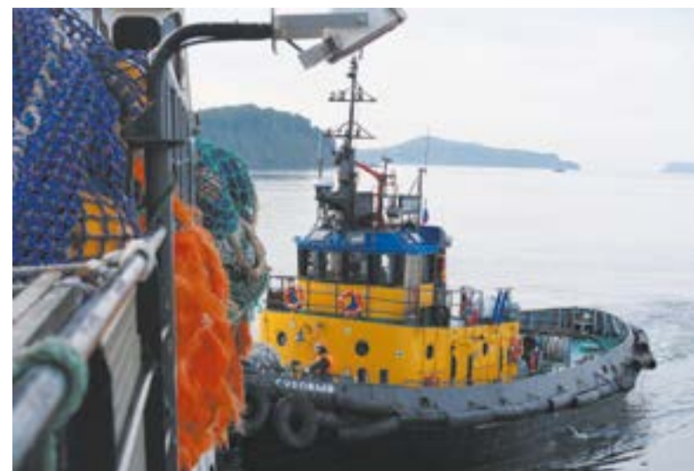
▲ «Суровый» за работой.