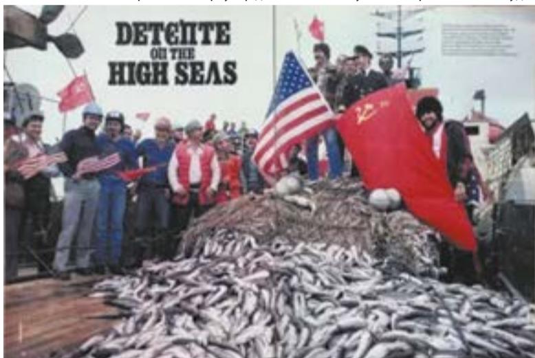
▲ Разворот американского журнала Life со статьей о советско-американской рыболовной экспедиции (август 1983 года)

отказаться от прежней практики сдачи улова на берег, а перегружать рыбу в море на советские суда для переработки. Проекту пришлось преодолевать «железную завесу», взаимное недоверие, бюрократические барьеры, противодействие перерабатывающих компаний США, которым, конечно, не нравилась перспектива конкуренции с иностранными переработчиками.