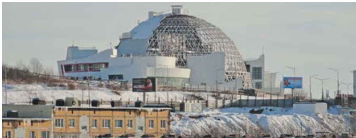
▲ Это будет не просто театр, а культурно-театральный центр