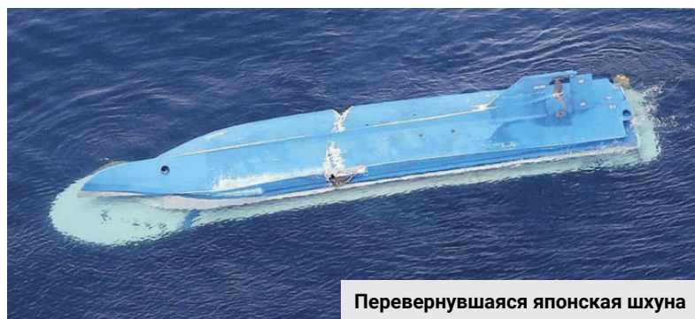
Перевернувшаяся японская шхуна

Как сообщает Федеральное агентство по рыболовству, оно держит ситуацию на контроле в тесном взаимодействии с ФСБ и МИД России. «Росрыболовство выражает соболезнования семьям погибших рыбаков и готовность оказать необходимое содействие в расследовании. По поручению руководителя Росрыболовства представитель агентства в Японии