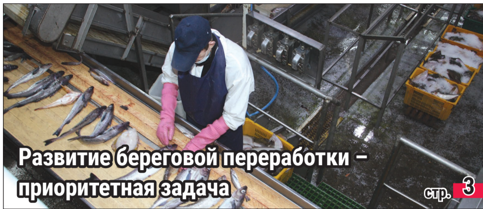
Развитие береговой переработки – приоритетная задача