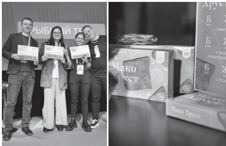
Команда с рыборастворительными снеками из макруруса заняла второе место

если будет другой ценовой диапазон и появится расширенная линейка полуфабрикатов.