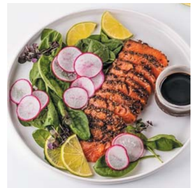
Пример готового рыбного блюда

Рыбных консервов выпущено на 3% больше, чем годом ранее, — 200 тыс. тонн. В этой категории, по данным экспертов, продолжается восстановительный рост после падения в 2022 г. Ему способствуют высокие показатели добычи мелкой пелагтики: в 2024 г. вылов сардины-иваси вырос на 3% к 2023 г. до 554 тыс. тонн, а вы-