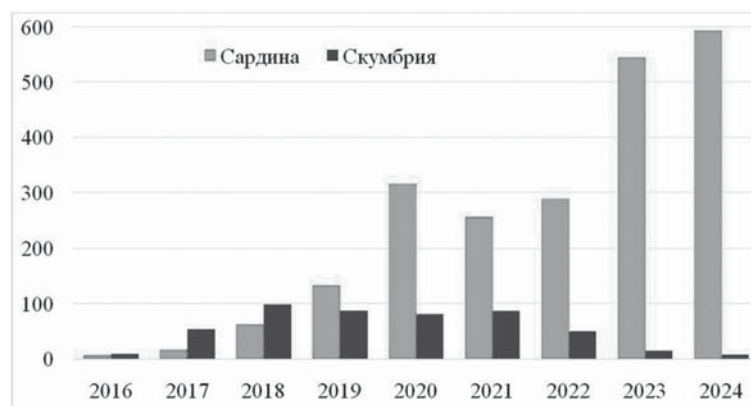
Вылов сардины-иваси и скумбрии российскими рыбаками в 2016-2024 гг.

Также рекордной в минувшую путину оказалась и эффективность работы добывающих судов на Дальневосточном бассейне. Средний вылов одним судном на судосутки зафиксирован на уровне 230 тонн, в то время как в 1980-е этот показатель не превышал 50 тонн.