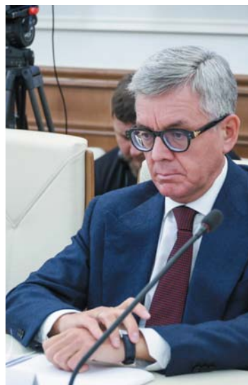
Герман ЗВЕРЕВ, президент Всероссийской ассоциации рыбопромышленников (ВАРПЭ)