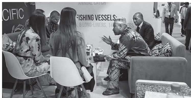
В специально оборудованной зоне российского павильона на всем протяжении мероприятия проходили двусторонние B2B-переговоры

и технологий пользовалась огромной популярностью у аудитории. По этой причине мы оцениваем участие как очень успешное. Теперь наступает наша очередь принимать но-