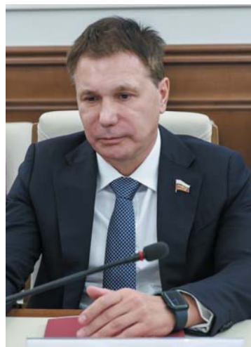
Игорь ЗУБАРЕВ, зампреда комитета по аграрно-продовольственной политике и природопользованию Совета Федерации