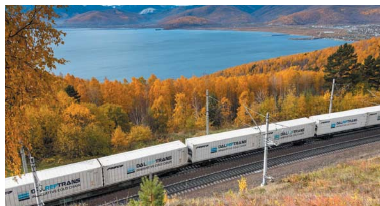
За прошлый год сервисом «Рыбный шаттл» отправилось более 5 тыс. TEU

Основу грузопотока «Рыбного шаттла» формировали белая рыба (более половины от общего объема отправок — треска, минтай, камбала и другие), кальмар, краб, красная рыба, креветки и прочая продукция из водных биоресурсов. FN