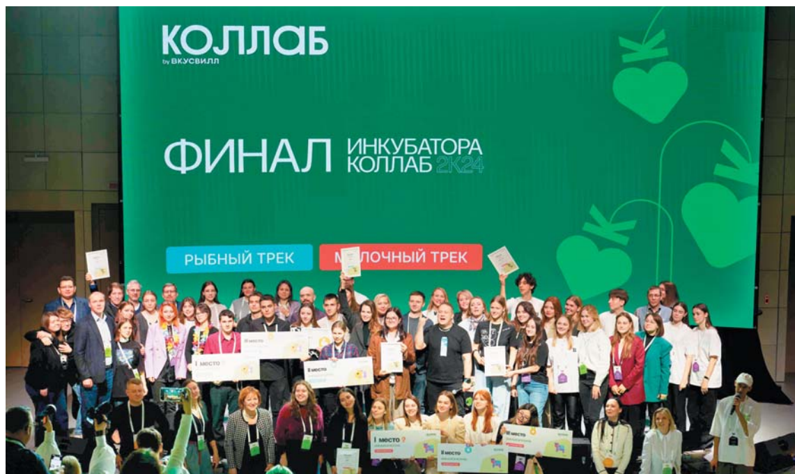
Инкубатор «Вкусвилл» — один из примеров коллаборации ритейла, промышленности и образовательных учреждений