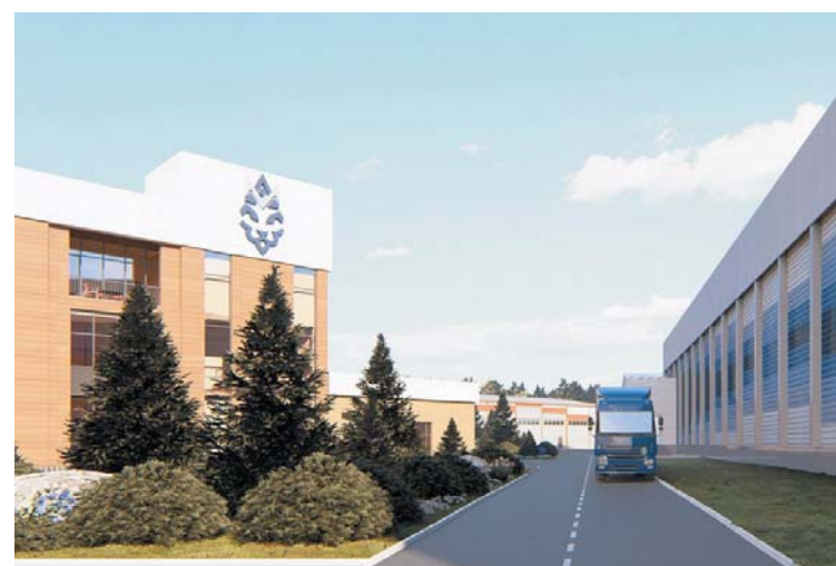
Склад будет расположен в Надеждинском районе. Предполагается содержание собственного автопарка на 30 единиц

Рекламодатель ООО «Айсберг» (ИНН 2540284047)