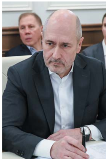
Александр ПАНИН, председатель Рыбного союза