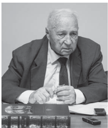
Василий ГЛУЩЕНКО, председатель правления Росрыбхоза

В министерстве считают, что добиться высоких показателей рыбоводы смогли благодаря успешной реализации инвестпроектов и национального проекта «Малое и среднее предпринимательство и поддержка индивидуальной предпринимательской инициативы». FN