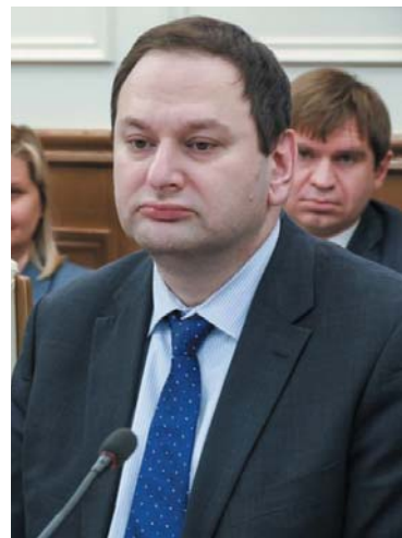
Евгений КАЦ, директор департамента регулирования в сфере рыбного хозяйства и аквакультуры (рыбоводства) Минсельхоза