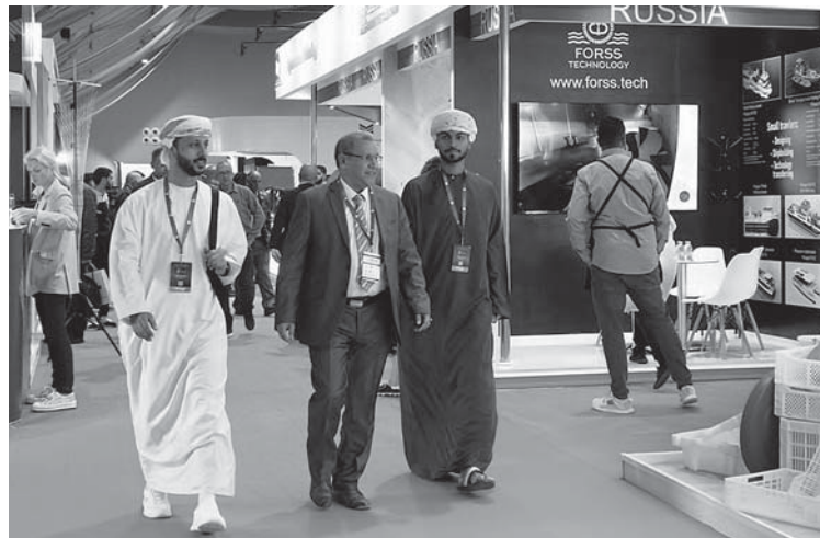
Выставку посетил премьер-министр Марокко Азиз АХАННУШ

«Потребности стран континента в рыбе и морепродуктах расширяются, что делает местные рынки особенно привлекательными для отечественных рыбопромышленных компаний, заинтересованных в новых направлениях экспорта. Этому же способствует и диалог на межгосударственном уровне, — отметил генеральный директор Expo Solutions Group Иван ФЕТИСОВ. — Российская экспозиция рыбной продукции