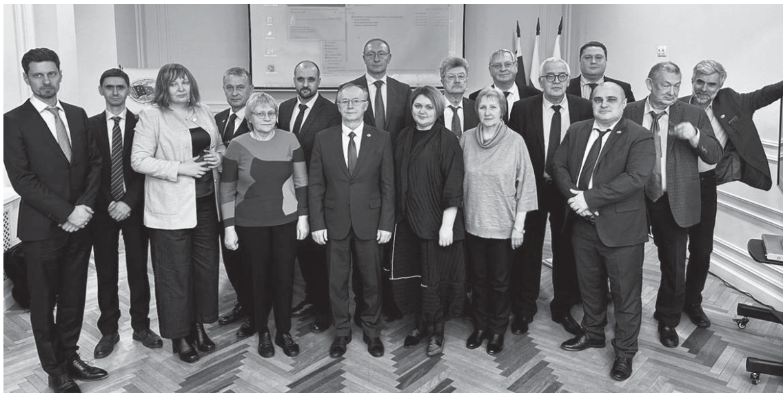
Участники отчетной сессии Всероссийского НИИ рыбного хозяйства и океанографии