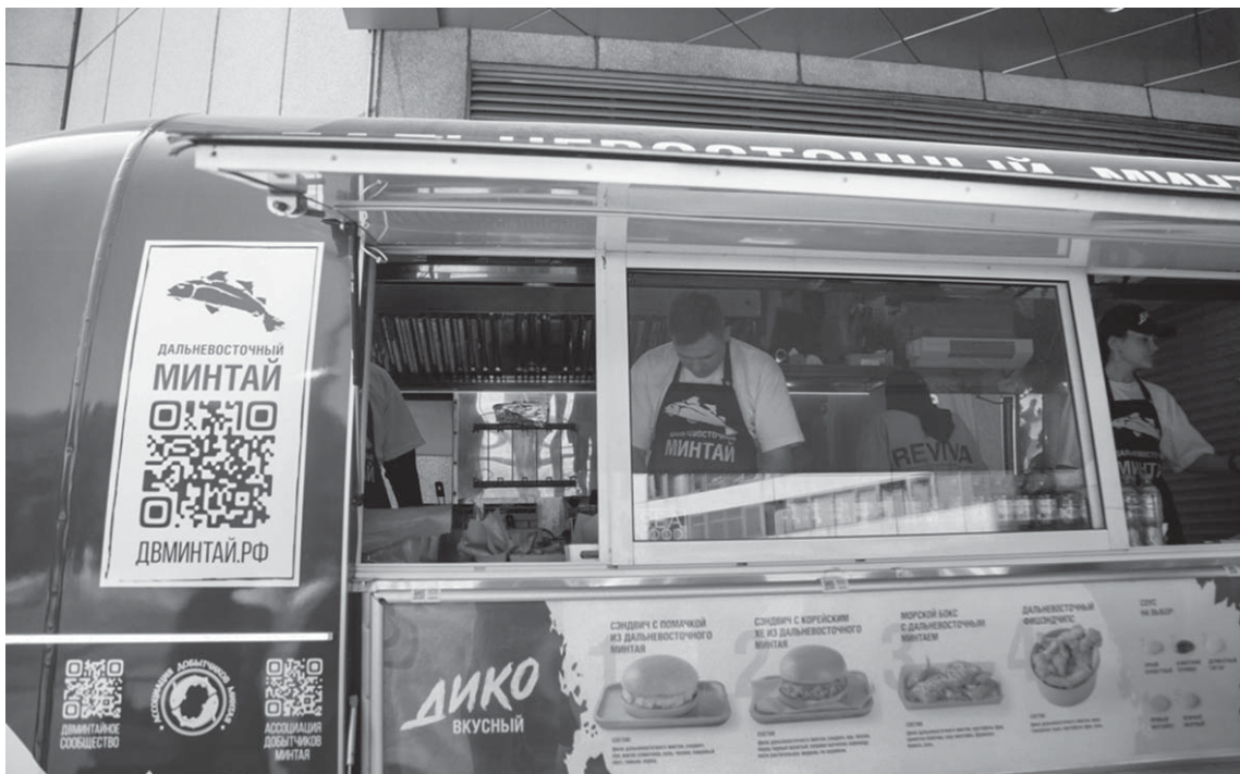
Фирменный фудтрак «Дальневосточного минтая» все лето работал на фестивалях в Москве и Подмосковье