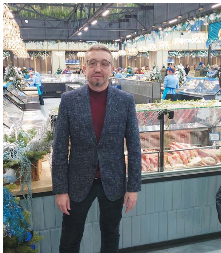
На открытии специализированного рыбного рынка «Москва — на волне», ноябрь 2023 г.

чтобы люди, покупая закуску к пиву, могли выбирать, взять им креветку либо опило. И, кстати, она неплохо сработала. Причем в дискаунтерах, в супермаркетах не премиального уровня.