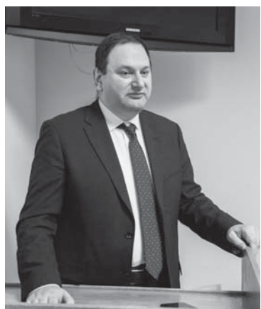
Евгений КАЦ, директор департамента регулирования в сфере рыбного хозяйства и аквакультуры (рыбоводства) Минсельхоза