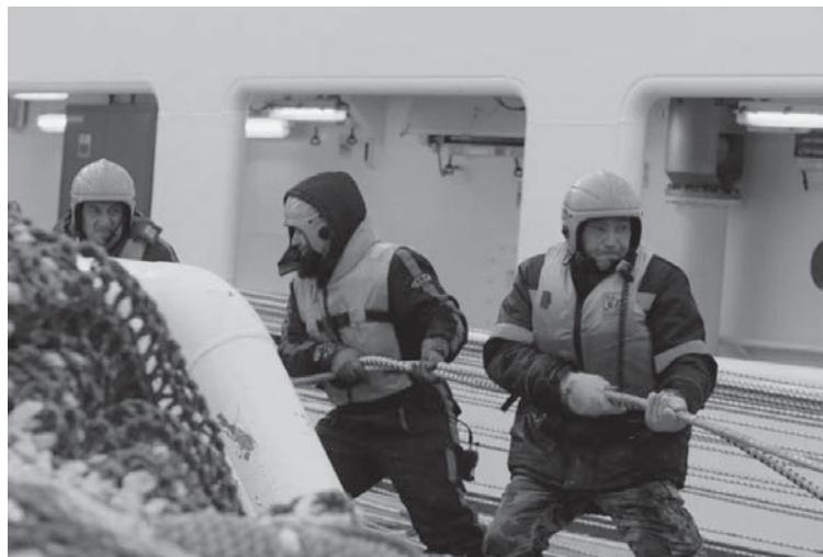
АДМ подготовила ролик ко Дню рыбака

Программа рассказывает о достоинствах минтая — «сокровища дальневосточных морей» — в разных форматах. Это специальный сайт, социальные сети, сотрудничество с блогерами, различные контент-продукты (от видеорецептов до мультфильмов) и, конечно, продвижение через дегуста-