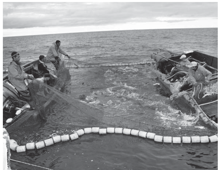
В обновленной редакции правил урегулирован вопрос с приловом минтая при добыче тихоокеанских лососей ставными неводами на Северных Курилах

Развитие промысла сельди важно в том числе для насыщения рыбной продукцией внутреннего рынка страны, отметил министр. Сельдь вхо-