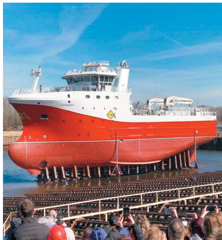
Краболов «Кильдин» строится для СЗПК

Судно «Кильдин» спустили на воду на заводе «Красное Сормово» в Нижнем Новгороде. Краболов-процессор строится по заказу Северо-Западного рыбопромышленного консорциума.