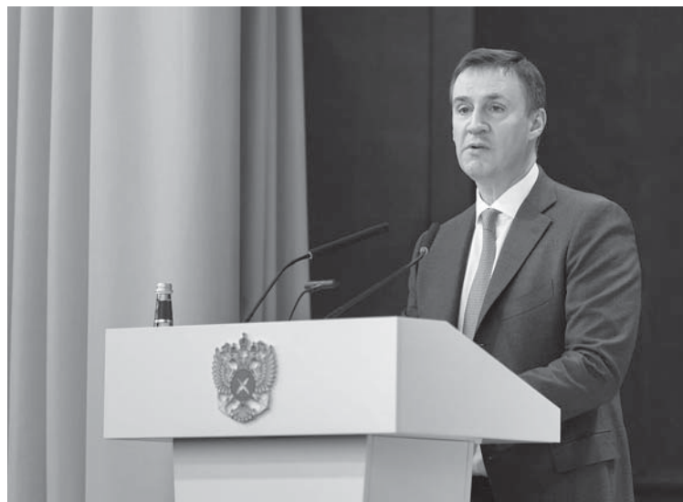
Дмитрий ПАТРУШЕВ, заместитель председателя правительства РФ

В 2024 г. начали работу пять новых предприятий, способных суммарно производить 114 тыс. тонн рыбных кормов в год, — в Астраханской, Нижегородской, Курской, Саратовской областях и Республике Северная Осетия — Алания. По данным Росрыболовства, до 2030 г. планируется реализовать еще 10 проектов по производству рыбных кормов в восьми регионах страны: речь идет о строительстве 9 новых заводов