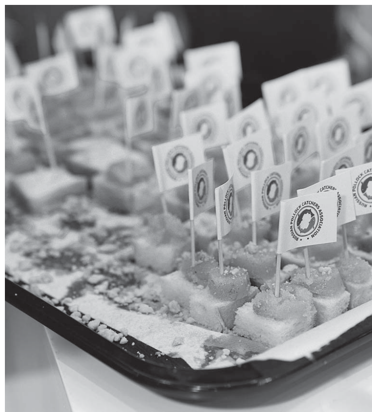
Осенью Ассоциация добытчиков минтая провела презентацию российской икры минтая на крупнейшей в Азии рыбопромышленной выставке China Fisheries and Seafood Expo в Циндао

В АДМ считают, что у икры минтая есть все шансы вписаться в кулинарный код Китая. Это универсальный продукт, который можно использовать самыми разными способами — в качестве самостоятельной закуски или