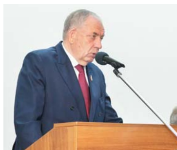
Сергей МИТИН, первый зампрединистрации комитета СФ по аграрно-продовольственной политике и природопользованию