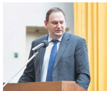
Евгений КАЦ, директор департамента регулирования в сфере рыбного хозяйства и аквакультуры (рыбоводства) Минсельхоза