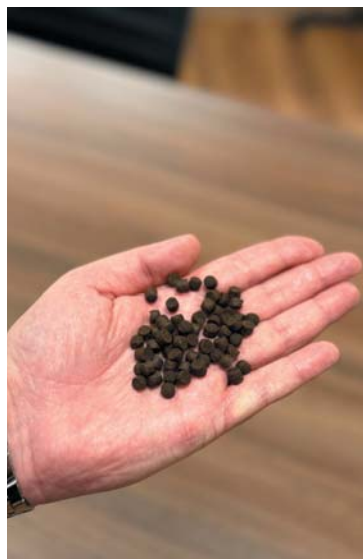
Рецептуры кормов компании «Возрождение» разработаны собственными технологами совместно с учеными Передовой инженерной школы «Институт биотехнологий, биоинженерии и пищевых систем» ДВФУ

бое внимание мы уделили уникальному премиксу, который содержит идеально сбалансированный комплекс витаминов, минералов и функциональных добавок,