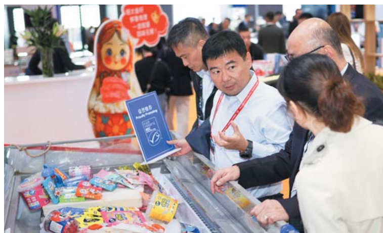
Сейчас китайские покупатели уделяют большое внимание качеству и экологичности продукции