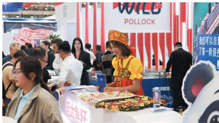
В прошлом году на выставке в Циндао активно использовались матрешки, кокошники и другие элементы традиционных костюмов и атрибутики

Он отметил, что ассоциация планирует организовать видеосъемку всех минтаевых рецептов, вошедших в шорт-лист конкурса, а затем разместить их в сообществах «Дальневосточного минтая» для широкого использования. FN