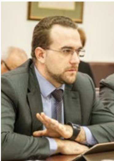
Александр КРУТИКОВ, директор департамента обеспечения реализации инвестиционных проектов Минвостокразвития