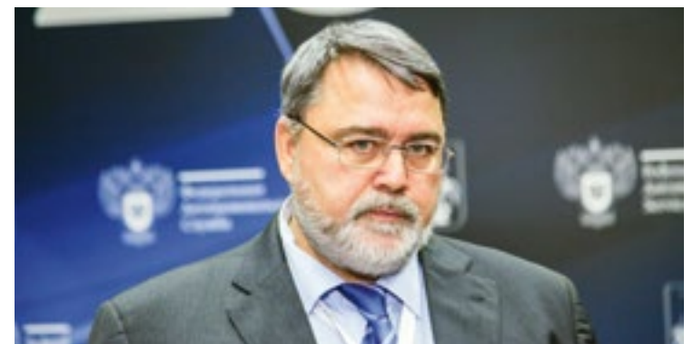
Игорь АРТЕМЬЕВ, руководитель ФАС

После постройки завода его собственник также сможет обратиться в Росрыболовство для получения «квот господдержки». На цели, связанные со строительством рыбоперерабатывающих заводов, предлагается отвести до 5% квот. «Будет разработана методика оценки этих проектов. Они должны быть достаточно высокого уровня – свыше 1 млрд. рублей инвестиций. Нам предстоит оценить и выделить, какие параметры этих проектов будут учтены с точки зрения пересчета на квоты.