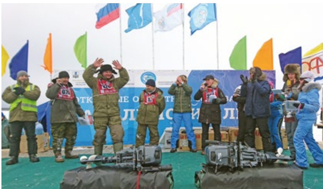
Вручение призов победителям