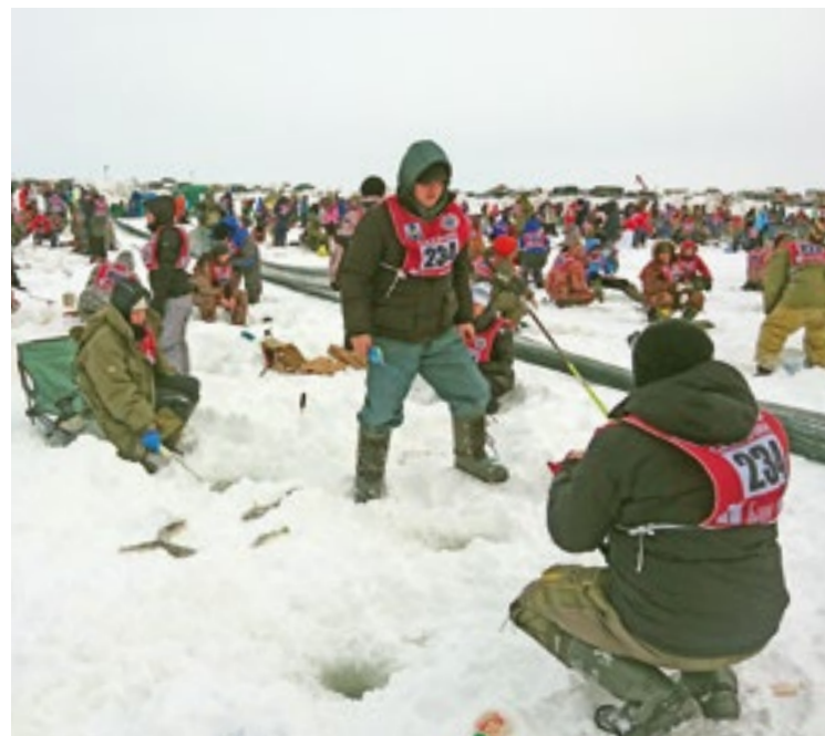
На свежем воздухе собралась 271 команда (по 4 человека в каждой)